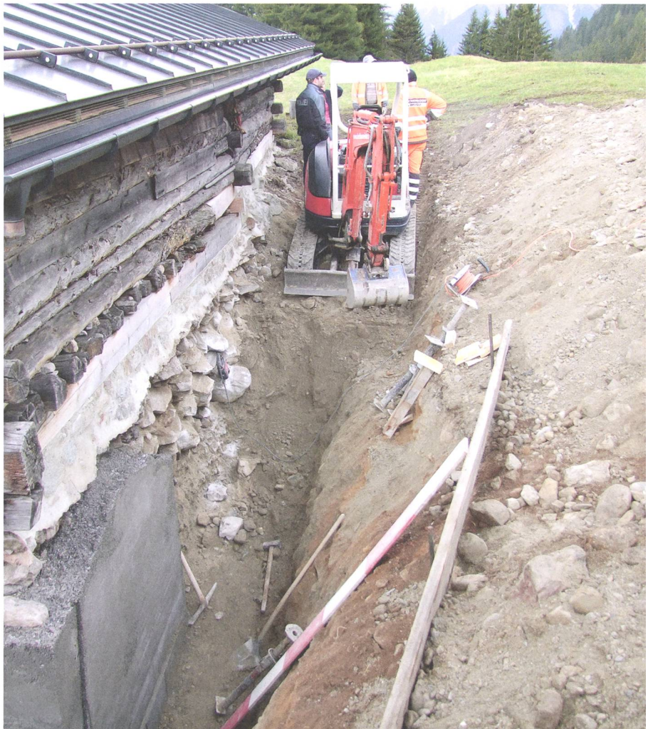
Abb. 1: Bergün Filisur, Falein/Pnez. Die Fundstelle der Skelette an der Nordseite des Stall-/Wohnhauses am 8. Oktober 2014.

Abb. 2: Bergün Filisur, Falein/Pnez. Blick in den Drainagegraben an der Nordseite des Stall-/Wohnhauses am 8. Oktober 2014.