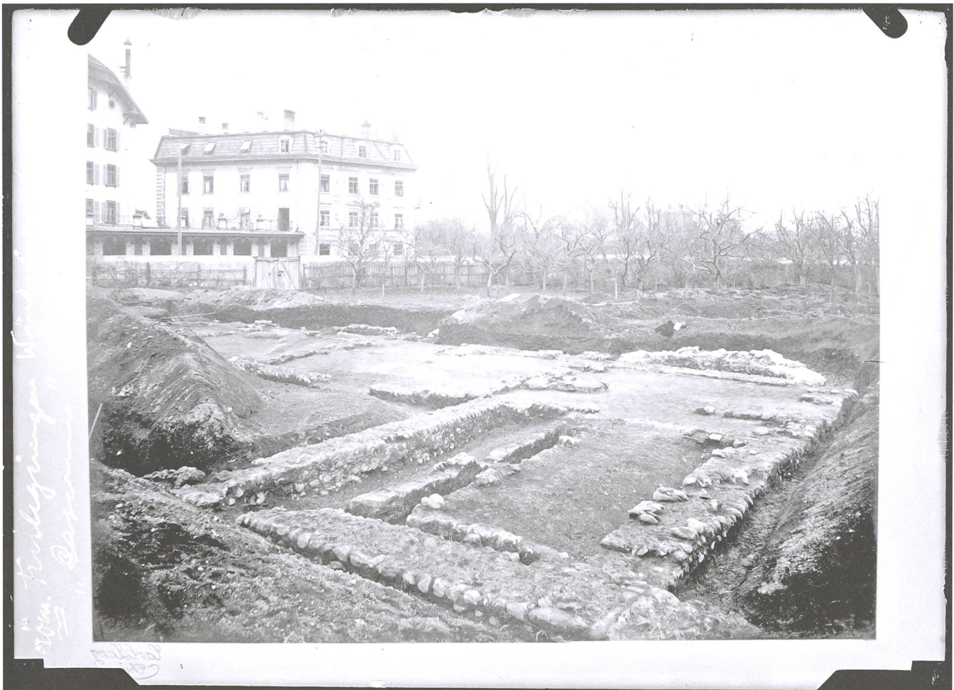
Abb. 1: Chur, Areal Custorei. 1902. Die erste Ausgrabung in Graubünden. Spiegelverkehrte Abbildung mit einer auf der Glasplatte angebrachten Notiz.

1902 wurde im Auftrag der Historisch-Antiquarischen Gesellschaft auf dem Areal der Custorei im Churer Welschdörfli die erste