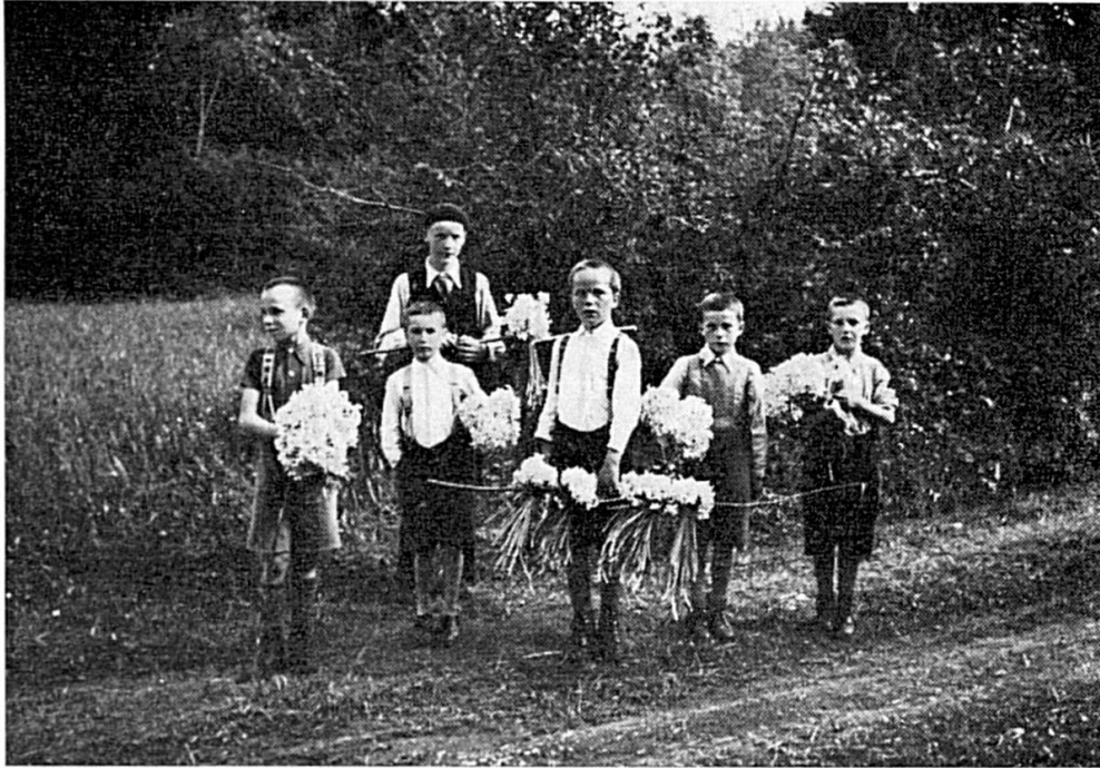
Le pillage des champs de narcisses de Damvant : Les fautifs sont ceux qui ne les éduquent pas

Nous avons vu maintes fois le spectacle sur les champs mêmes, le spectacle de la course aux fleurs, les jours de grande affluence. Des personnes de tous âges s'abattent, avides, sur ces prés parfumés et rivalisent de zèle dans la razzia. C'est à qui ramènera, dans le minimum de temps, la plus grande masse de