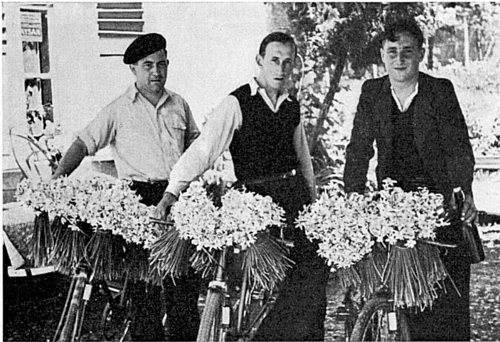
Le pillage des champs de narcisses de Damvant: Après la victoire!

Ces faits, chaque année renouvelés, nous ont engagés à demander la mise sous protection des champs de narcisses de Damvant. N'importe quel paysan de la contrée vous dira que les