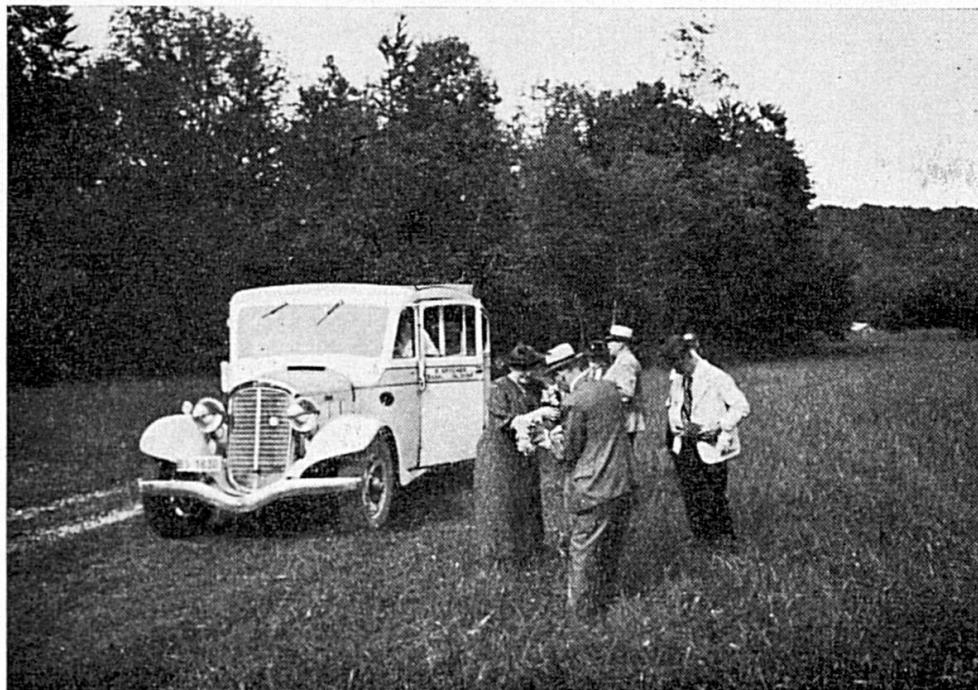
Le pillage des champs de narcisses de Damvant : La grande expédition

En Ajoie, le mouvement pour la protection de la nature est, en fait, inexistant. Porrentruy, la capitale, ne donne pas toujours l'exemple de ce qu'il faut faire dans ce sens. Précisons, pour ne vexer personne, qu'il ne s'agit ici ni d'urbanisme, ni d'embellisse-