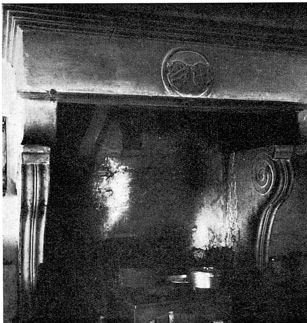
Manteau de la cheminée de la salle des chevaliers