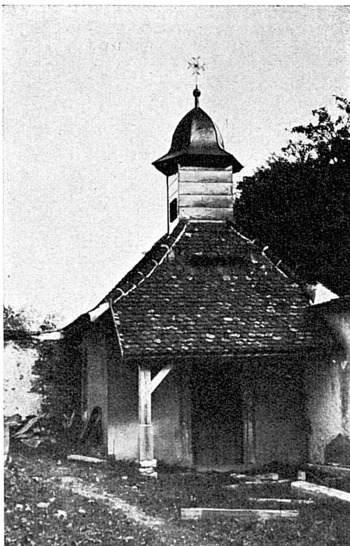
La chapelle rénovée de Raymontpierre.