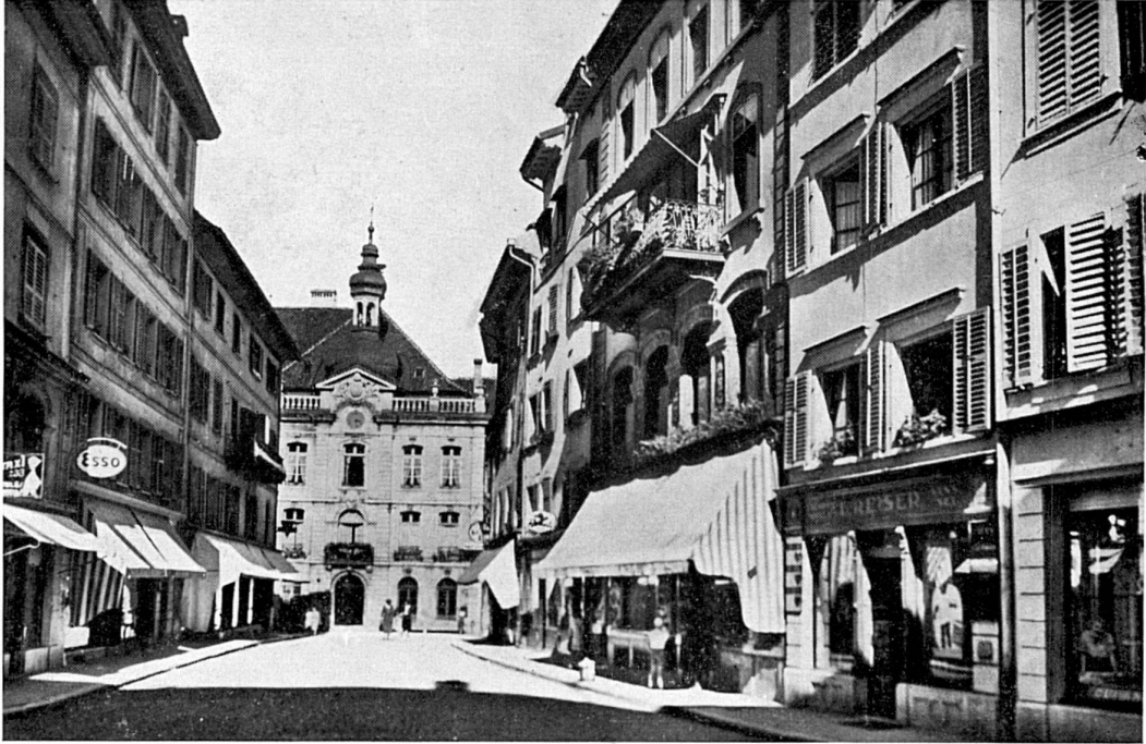
Cliché Adij. 285