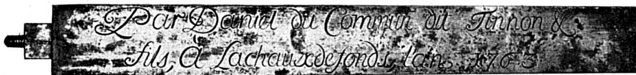
Cliché Adij 314

signé : Daniel du Commun dit Tinnon. Joseph Marchand.