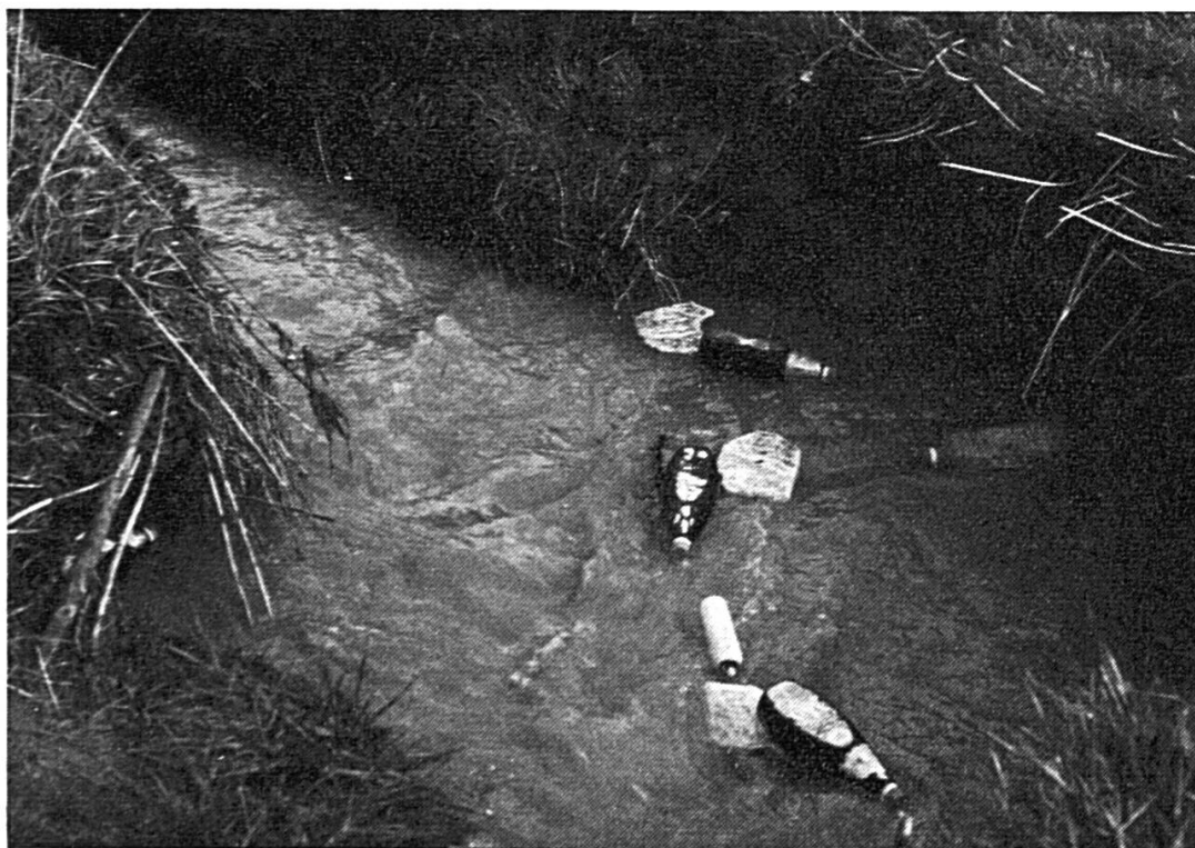
« Bouteilles perdues », mais hélas retrouvées !!!

en eau potable y est aigu, comme dans tous les pays calcaires : le Karst yougoslave, par exemple, ou les Causses, dans le sud de la France.