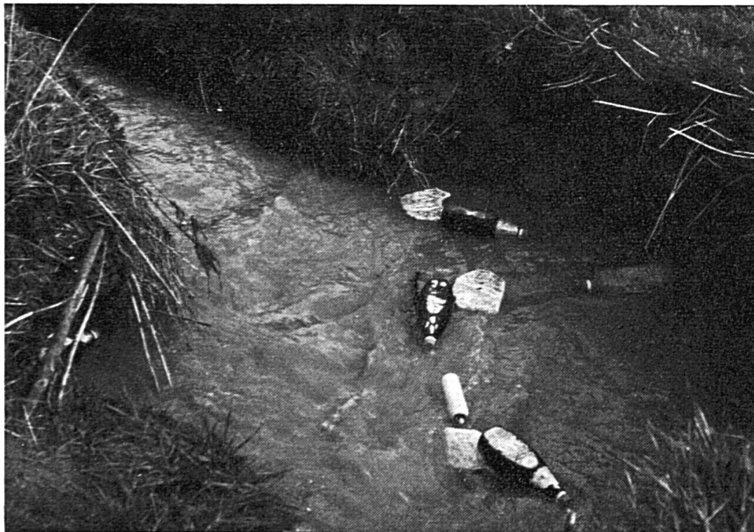
« Bouteilles perdues », mais hélas retrouvées !!!

en eau potable y est aigu, comme dans tous les pays calcaires : le Karst yougoslave, par exemple, ou les Causses, dans le sud de la France.