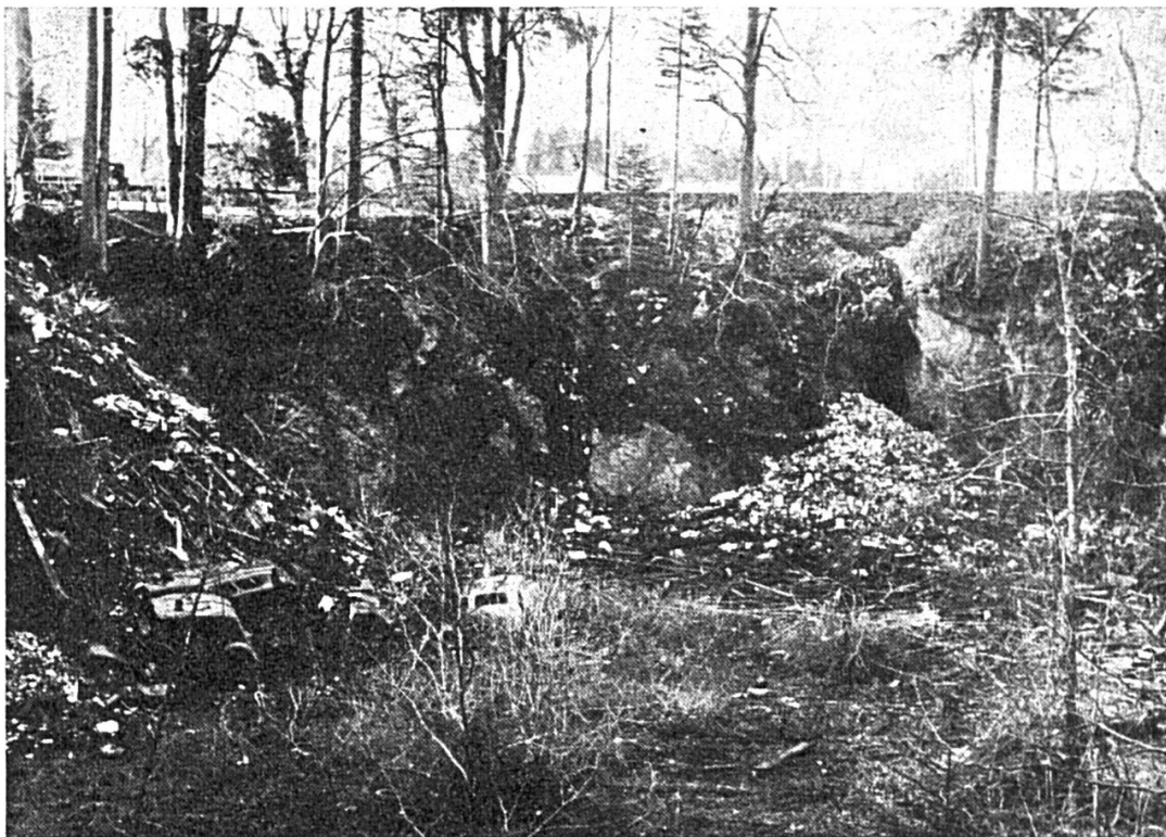
Dépôt d'ordures à interdire.

disposons encore. Il y a lieu dès lors de prendre des mesures de protection très énergiques, mesures que les autorités municipales devraient appliquer rigoureusement, dans leur propre intérêt.