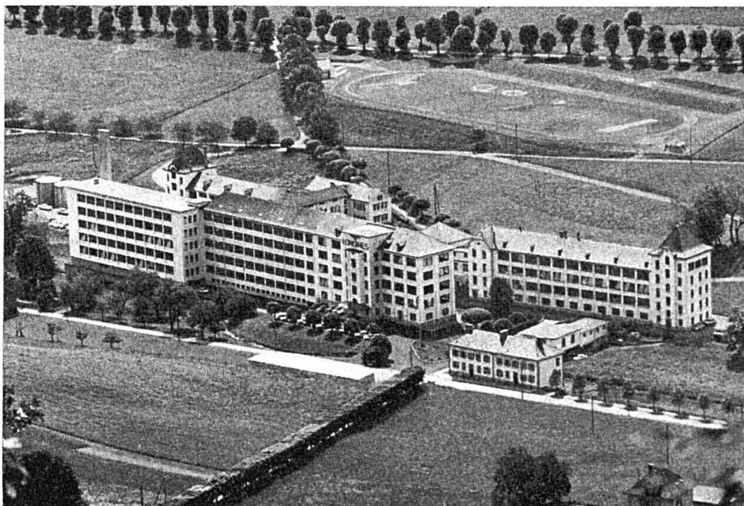
L'actuelle fabrique principale des Longines, à Saint-Imier.