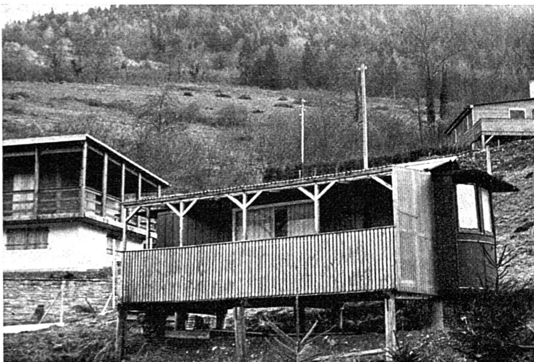
Quand on ne veut plus des trams en ville, on les utilise à la campagne (bords du Doubs)