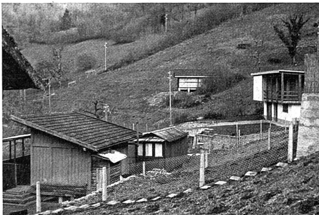
Dans la région du Doubs, la résidence seconde s'installe dans le désordre