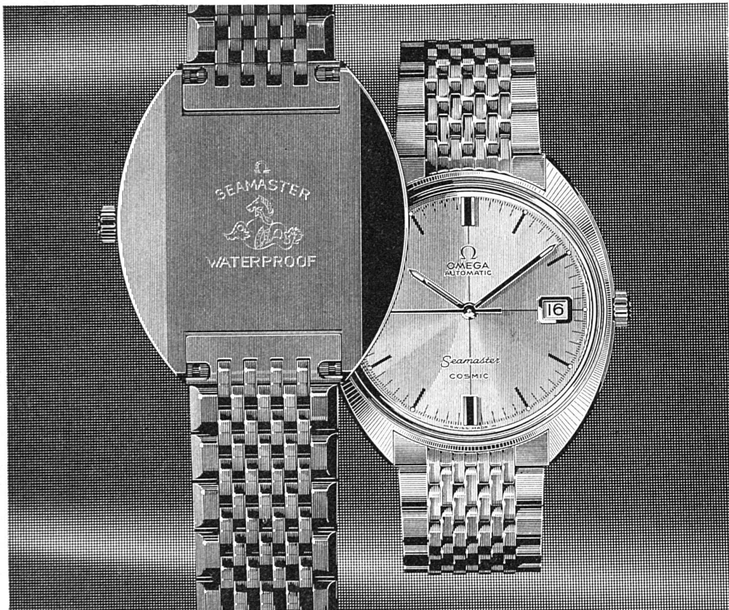
La Seamaster Cosmic: Etanche, calendrier, remontage automatique ou manuel