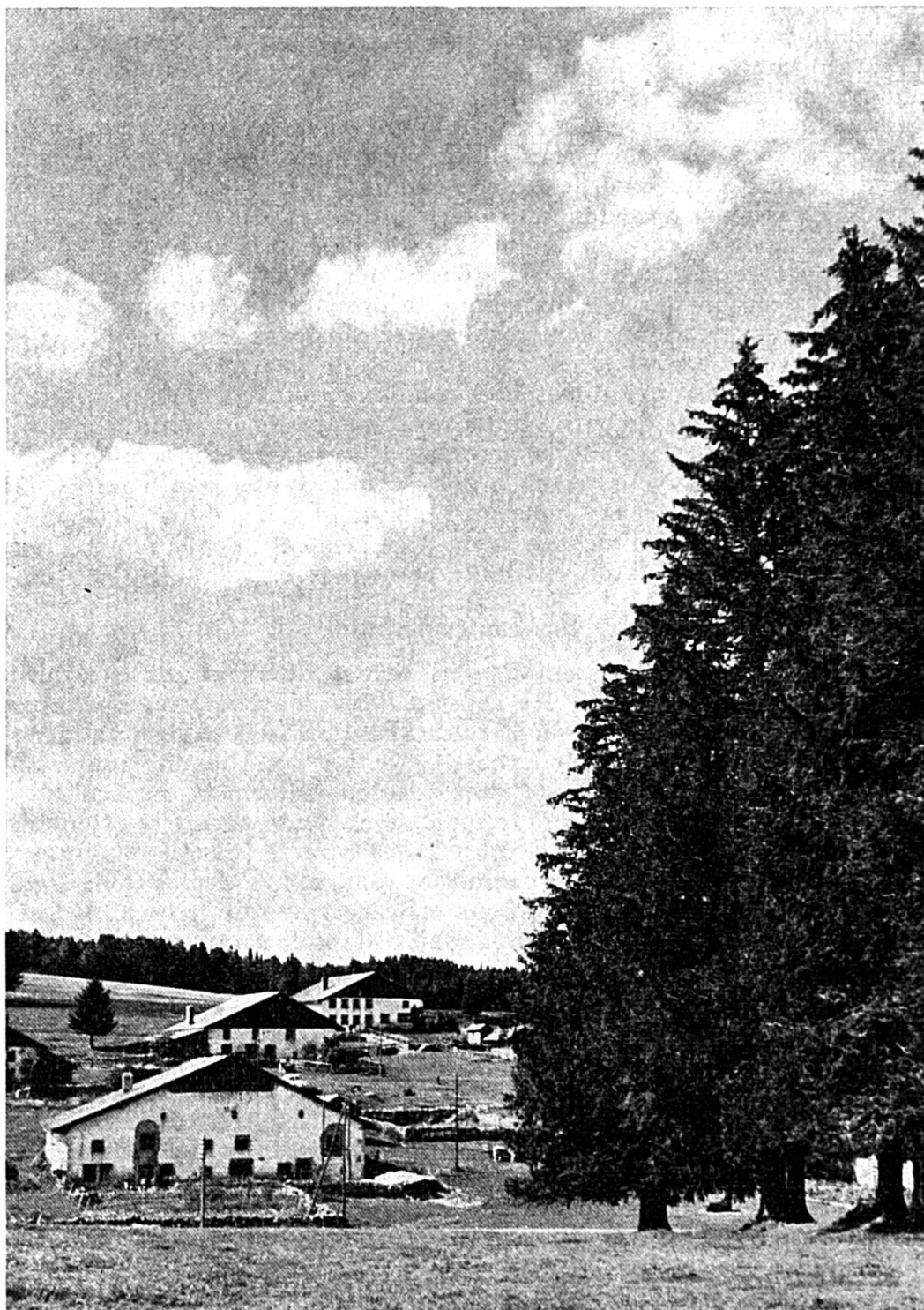
Paysage des Franches-Montagnes

Clichés obligeamment mis à disposition de l'ADIJ par Pro Jura, Office jurassien du tourisme.