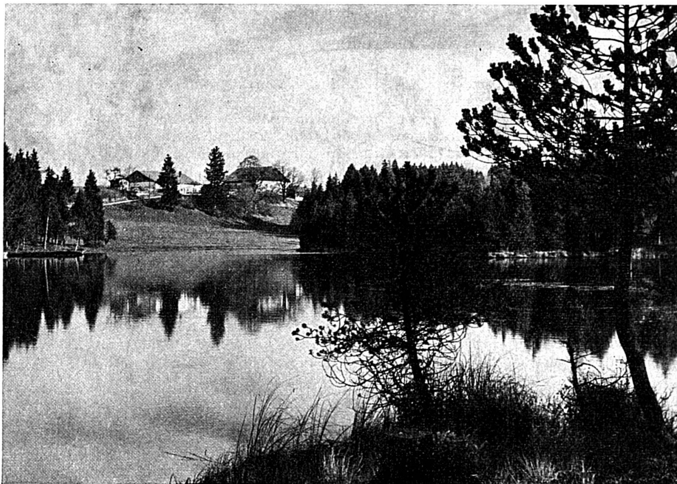
L'étang de la Gruère