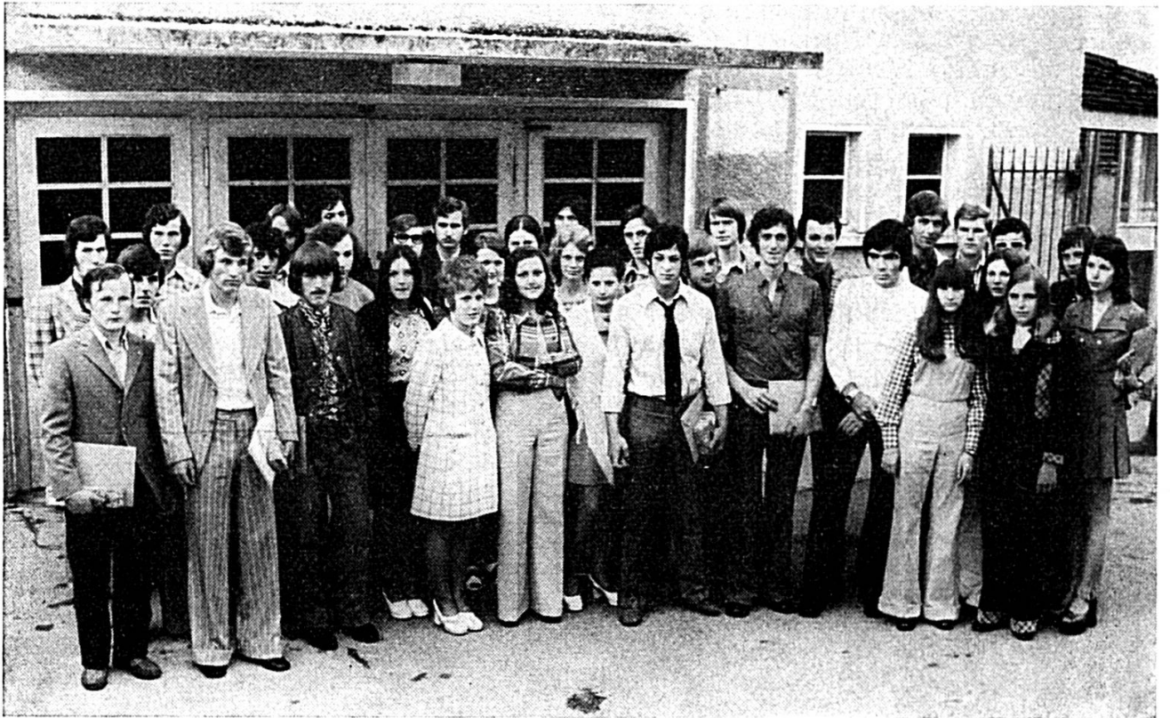
Les apprentis méritants