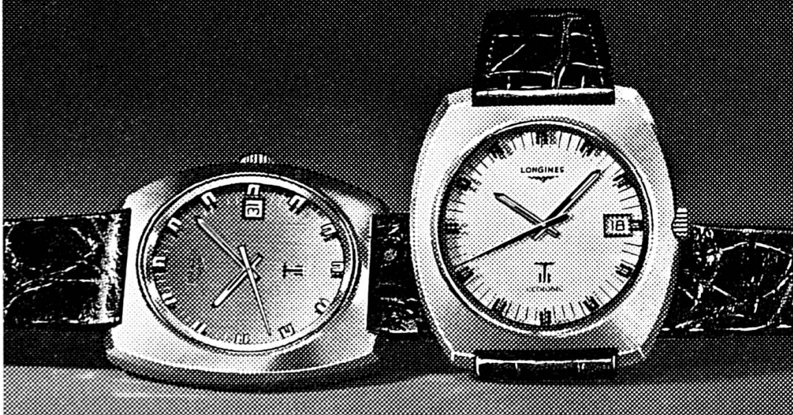
Réf. 8477 Ultronic. Electronique à diapason. Précision de l'ordre de la minute par mois. Etanche. Date. Disponible en acier, plaqué or et en or.

Depuis plus d'un demi-siècle Longines contribue à l'amélioration des performances sportives mondiales par la qualité et la précision de ses chronométrages.