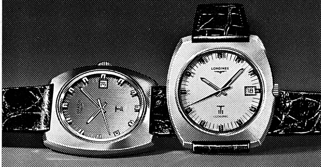
Réf. 8477 Ultronic. Electronique à diapason. Précision de l'ordre de la minute par mois. Etanche. Date. Disponible en acier, plaqué or et en or.

Depuis plus d'un demi-siècle Longines contribue à l'amélioration des performances sportives mondiales par la qualité et la précision de ses chronométrages.