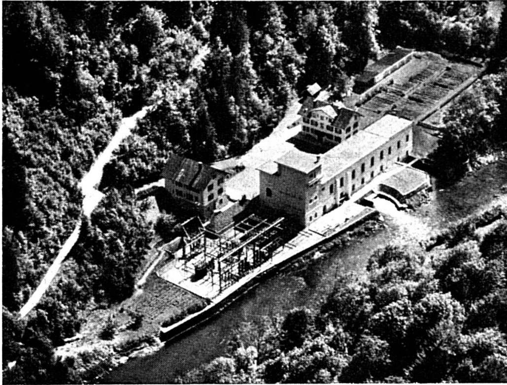
USINE DE LA GOULE SUR LE DOUBS