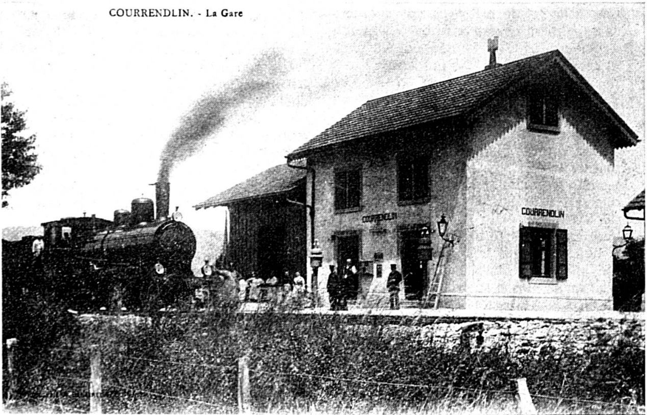
Locomotive B 3/4 du JS en gare de Courrendlin, vers 1900.