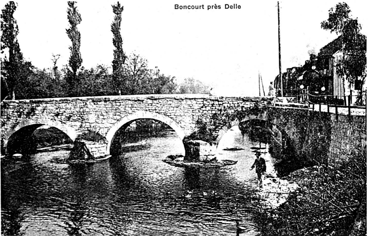
Passage d'un train du Jura-Simplon à Boncourt, vers 1900.