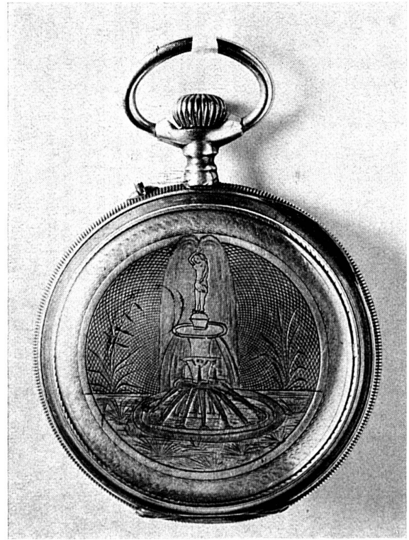
Montre avec fond de boîte guilloché et sujet gravé : femme et fontaine.