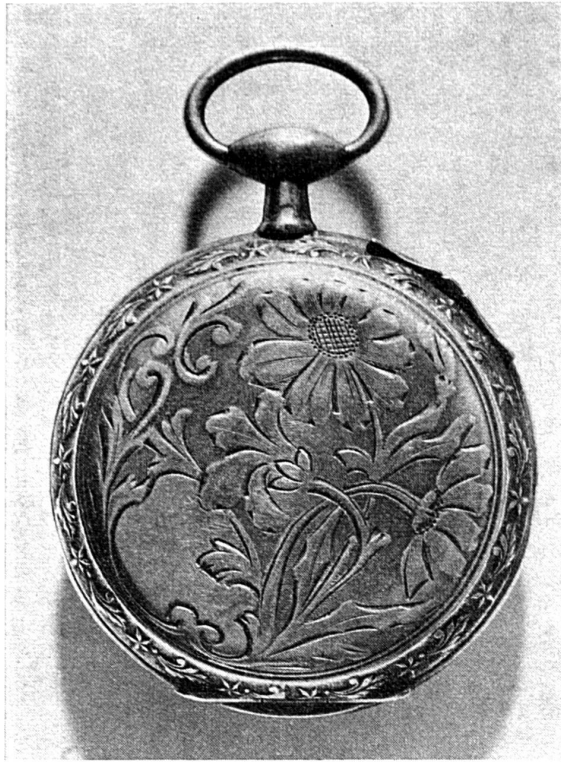
Montre avec fond de boîte gravé : fleurs et feuilles stylisées.