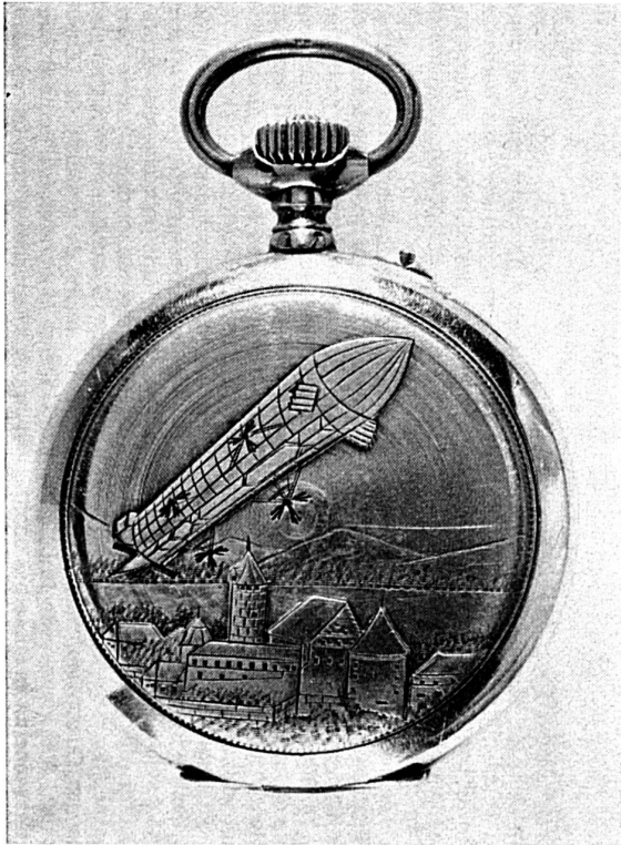
Montre avec fond de boîte gravé : le Château de Porrentruy et le « Zep- pelin », 1912.