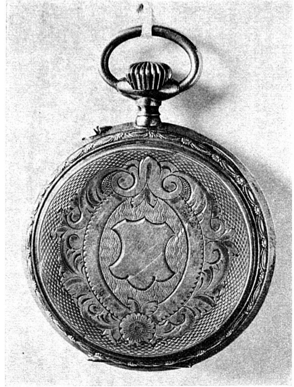
Montre avec fond de boîte guilloché et grand écusson.