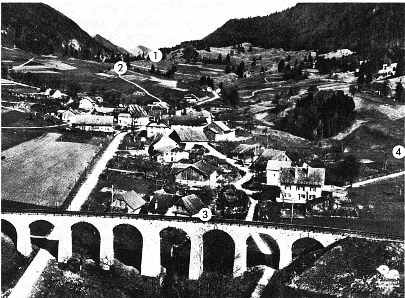
① Minière. ② Lavoir. ③ Martinet. ④ Crassier de la Creuse.

reliait en effet Erschwil à Crémines (Creux-de-mines). Sur le territoire communal, on peut encore voir les emplacements de deux anciennes minières, desquelles on extrayait un minerai que l'Inspecteur des mines décrit dans les années 1820 de la façon suivante : « On remarque de grands amas de minerai