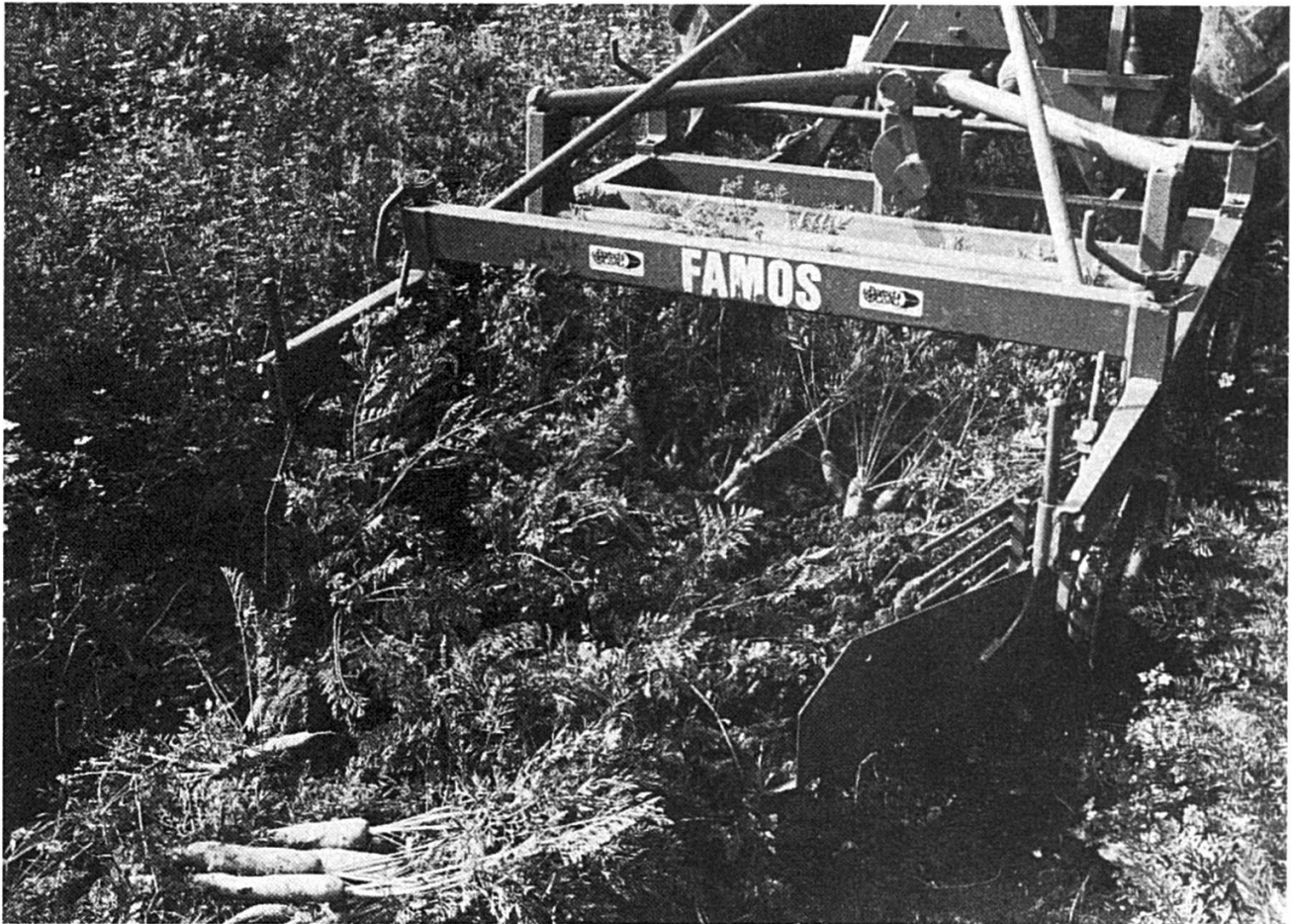
Instant privilégié, la récolte.