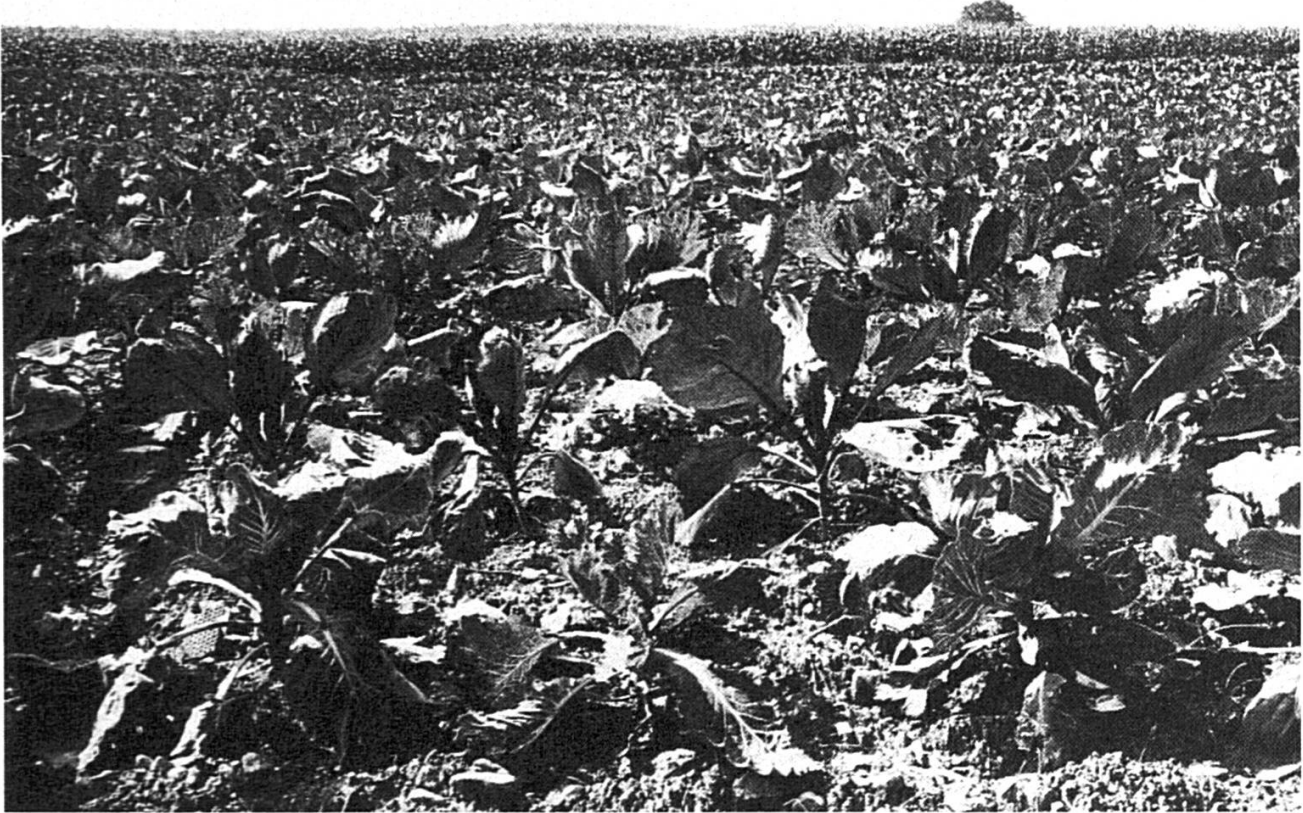
Carottes et poireaux.