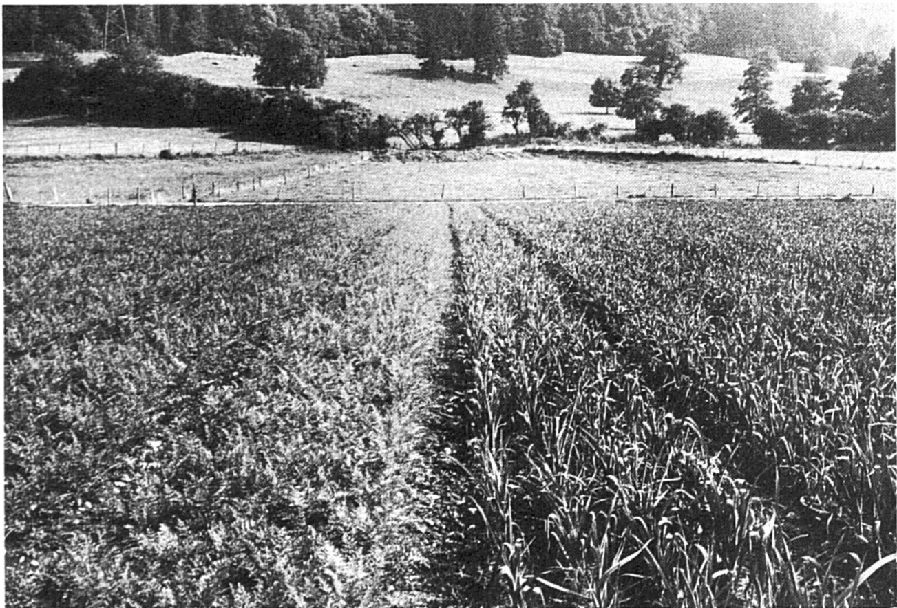
Choux avant « pommaison ».