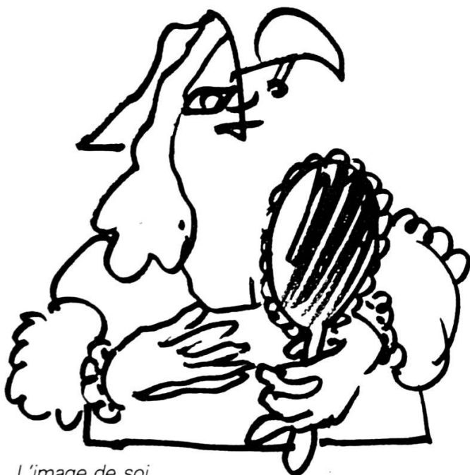
L'image de soi.

deroles et les poings levés n'existent plus guère. La vague de fond surgie de mai 1968 serait venue mourir lentement sur les rivages des années 80... Ainsi, aujourd'hui, la grande masse des élèves subirait la scolarité obligatoire en rêvant à de petits boulots, tandis qu'une minorité cheminerait passivement sur les filières longues de la réussite universitaire. Les étudiants ne feraient plus peur à la société: barricadés derrière leurs