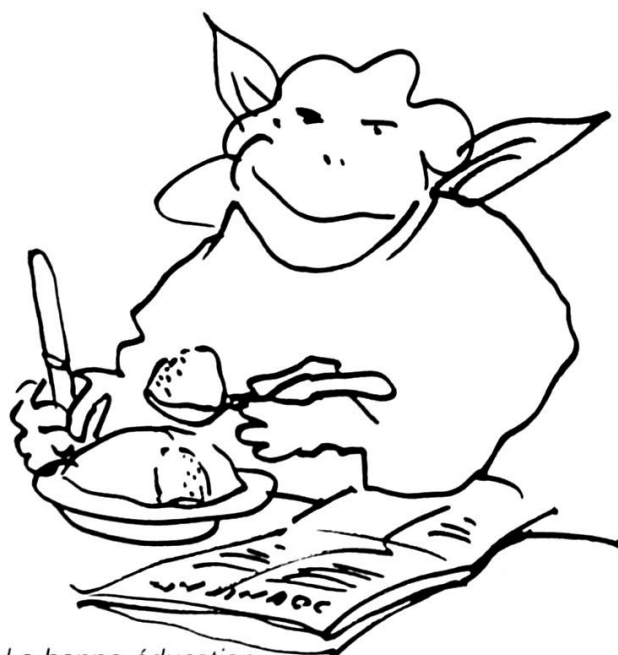
La bonne éducation.

Aujourd'hui, le phénomène s'est considérablement développé. Il s'est banalisé. Le travail temporaire permet de réunir les moyens matériels. Le temps disponible s'est élargi. Et la généralisation des possibilités de transport, l'américanisation de la musique, la globalisation des références culturelles, alimentaires, vestimentaires ont conduit à une multiplication de contacts, d'échanges et de déplacements de jeunes, de tous les milieux. Il est ainsi né une sorte de mondialisme qui, par certains côtés, s'apparente à ce que fut, dans une autre époque, et à une moindre échelle, la camaraderie de régiment. La réalité est là : non seulement les jeunes voyagent plus que par le passé, mais ils ont, à 20 ans, souvent vu davantage de pays que leurs parents de 50 ans. L'organisation de leur vie et, en particulier, leur entrée dans la vie active, s'en trouve modifiée : il est de plus en plus courant de voir des collégiens ou des apprentis prévoir un « grand