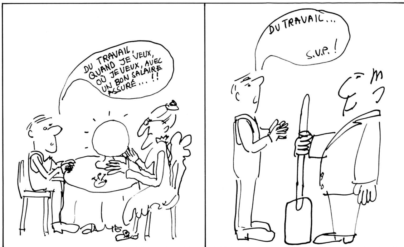
De la flexibilité rêvée à la flexibilité... conseillée!

puter le fait que la crise des années septante n'ait pas eu des effets dévastateurs.