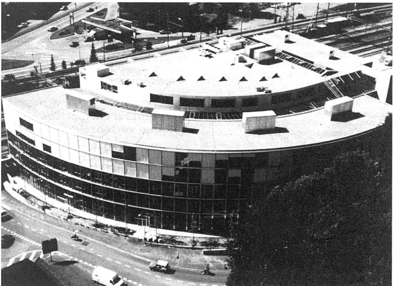
Le siège actuel de la SQS à Zollikofen.

Enfin, lors de l'audit de certification, les auditeurs SQS vérifient si les exigences des normes ont été satisfaites et si le système de gestion de la qualité est appliqué dans son intégralité. Le certificat est délivré par le Comité après examen des résultats de l'audit. Au cours des trois ans qui suivent, l'entreprise doit maintenir son système de gestion de la qualité, ce que viendra confirmer un audit de renouvellement ainsi que des vérifications de routine annuelles.