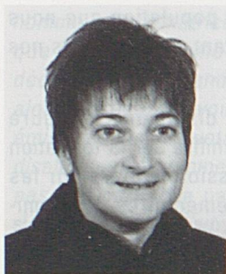
par Madeleine Froidevaux, Association Lire et Ecrire, Bienne.