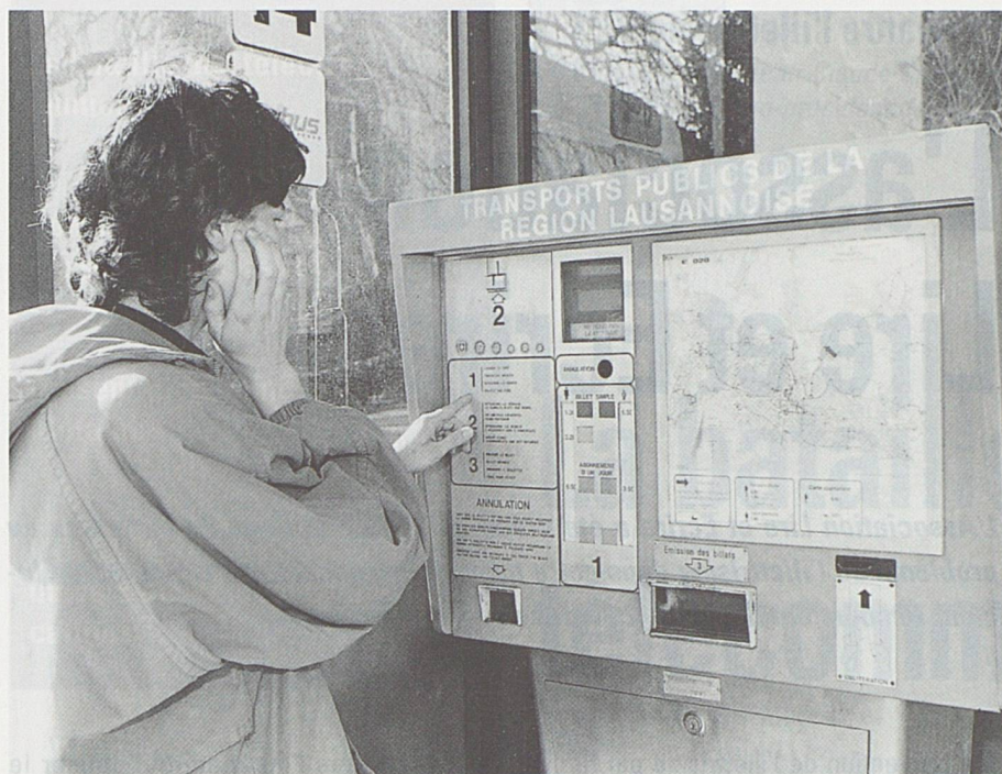
L'incapacité de déchiffrer ou de comprendre un texte simple constitue un grave handicap dans une société où les exigences vont croissant... (photo fournie par l'association Lire et Ecrire).

de 20 ans et plus résidant en Suisse sont plutôt alarmantes. (Voir tableau de la page précédente).