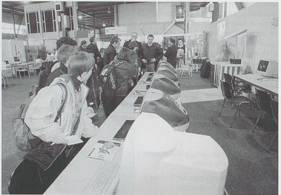
Vue générale de la BIMO 1999, à la Halle des Expositions de Delémont.

L'EPFL-Lausanne participera à la dixième édition de la BIMO par un stand interactif facilitant le dialogue avec les visiteurs de tout âge et présentant des démonstrations dynamiques dans des domaines de pointe de la robotique et du génie médical. Le 15 mars 2001 à 17 h 00, le forum organisé permettra de réunir les écoles, les milieux de l'économie, la promotion économique et le centre d'appui scientifique et technologique (CAST) de l'EPFL.