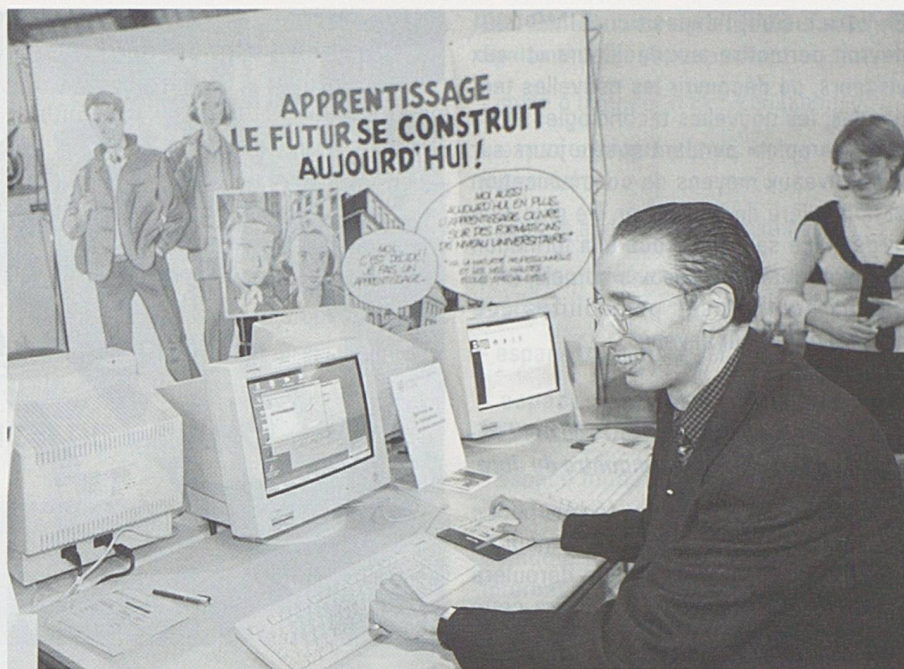
Le Ministre Jean-François Roth au stand de la formation du canton du Jura, lors de la BIMO 1999 (photo Bist).

La BIMO, souhaitant poursuivre son développement sur l'Arc jurassien, s'est adressée au parc scientifique et techno-