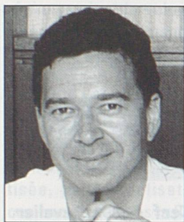
par Jean-Paul Bovée, secrétaire général de l'ADIJ