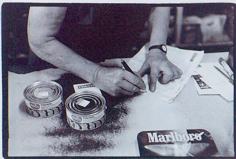
Mémoires d'Ici, fondation régionale ouverte au public, recueille et met en valeur non seulement les témoins du passé, mais aussi ceux qui reflètent l'actualité d'aujourd'hui, qui sera le passé de demain.

Jura bernois. Le CEJARE, Centre jurassien d'archives et de recherches économiques, a récemment été créé pour sauvegarder et mettre en valeur ce patrimoine, au-delà des aléas de la conjoncture économique. Proche par sa vocation et par son travail de l'activité de Mémoires d'Ici, le CEJARE est installé sous le même toit que Mémoires d'Ici qui se réjouit de développer l'un des partenariats indispensables à l'approfondissement de la