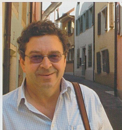
Par Jean-Paul Bovée

Conjoncture industrielle en Suisse et dans nos régions