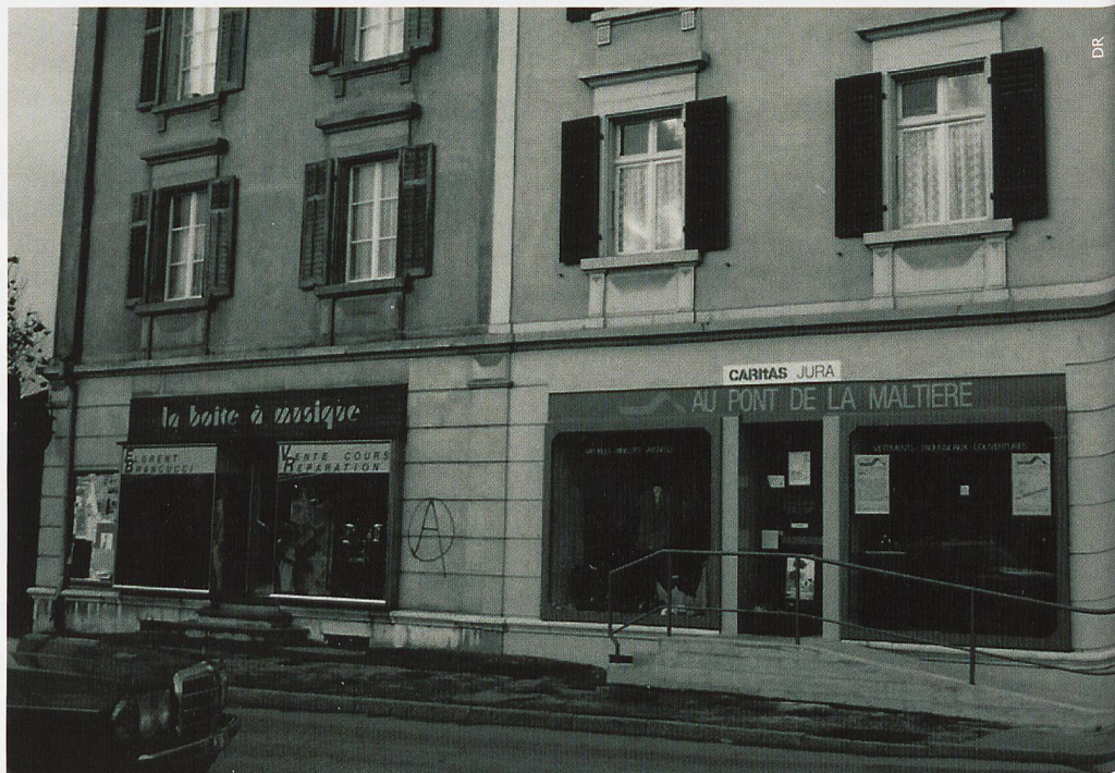
Les locaux actuels du magasin de Caritas Jura sont situés au Quai de la Sorne 2.