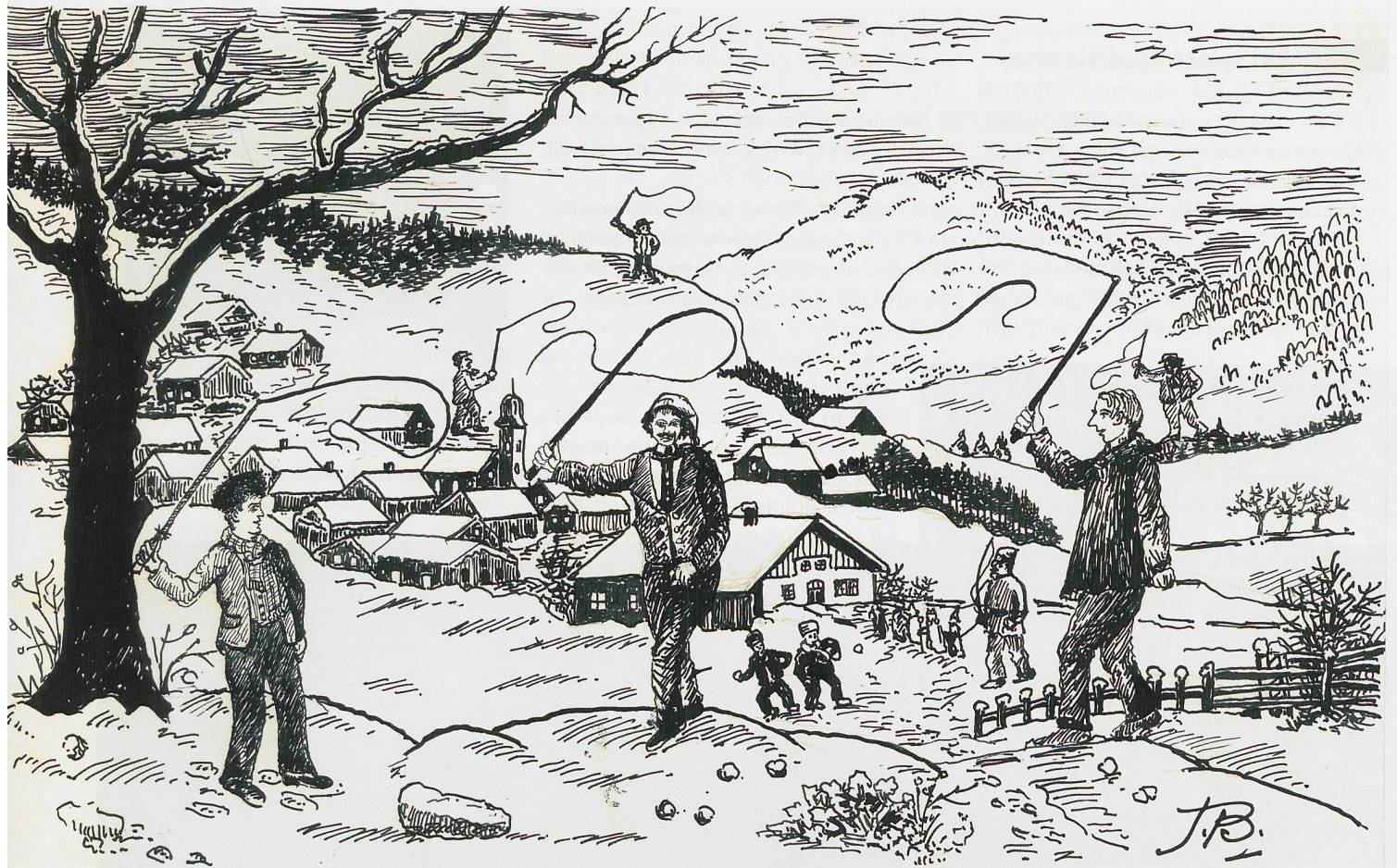
Dessin de Joseph Beuret-Frantz (1878 – 1958), © Musée jurassien d'art e: d'histoire à Delémont

Dans les Franches-Montagnes et dans le Clos du Doubs notamment, les jeunes garçons claquaient le fouet à la nuit.