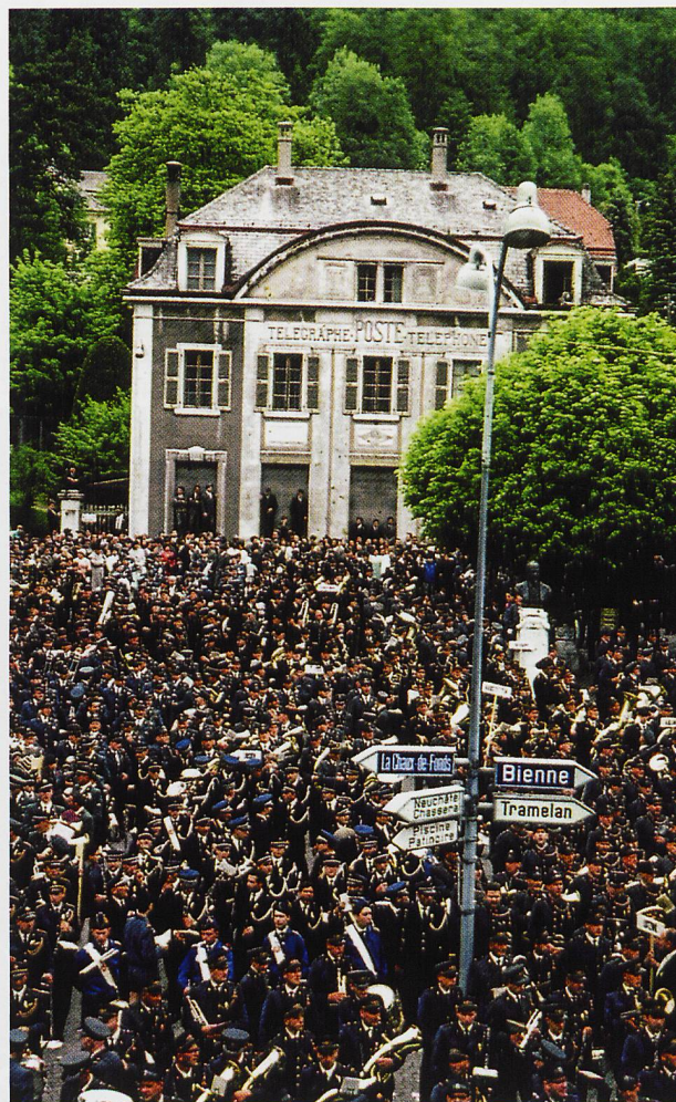
Fête cantonale des musiques à Saint-Imier, autre émanation du XX e siècle dans le registre des grands rassemblements traditionnels qui ont supplanté les modes de divertissement du XIX e siècle.

****Le Folklore du Haut-Erguel, (1933) par Robert Gerber, Actes de la Société jurassienne d'Emulation.