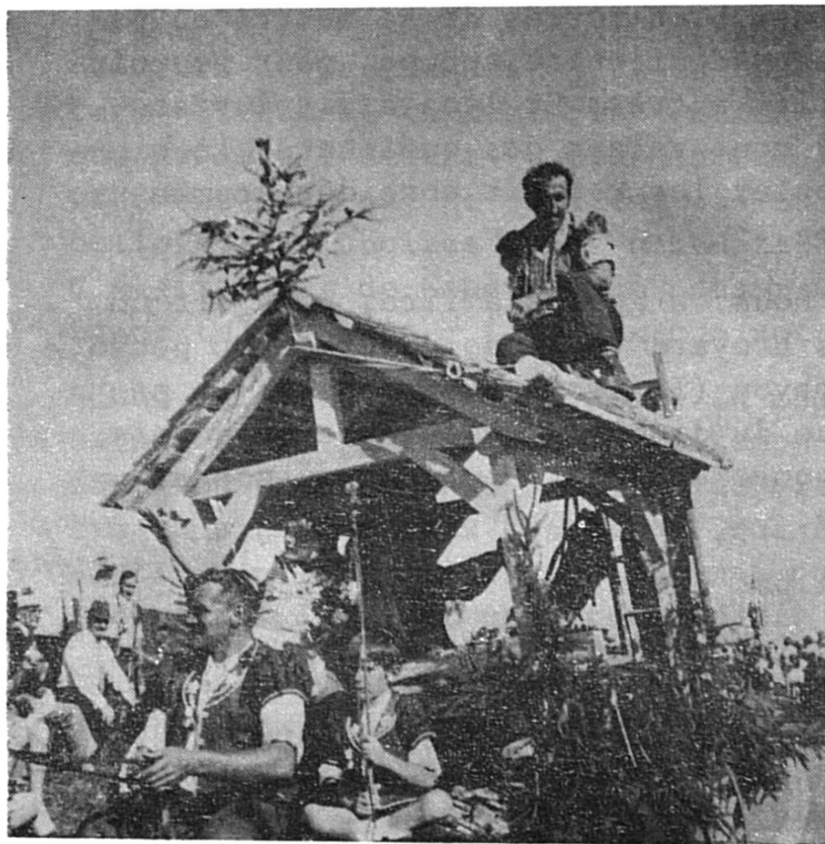
Le "bouquet" sur le nouveau faîte

REFLETS de la fête romande des patoisants à TREYVAUX les 1 et 2 septembre 1973