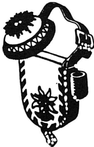
Une amie du patois.

Nous donnons rendez-vous dans 4 ans à tous les patoisants, peu importe le lieu de rencontre, nous sommes certains qu'une manifestation pour le sauvegardé de nos anciennes langues et coutumes ne peut être qu'une réussite.