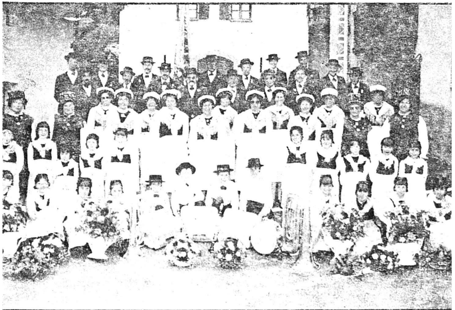
Partichiou de Chermignon.

Quand le patois ne serait qu'un prétexte à faire se rencontrer les gens, rien que pour cela, il mériterait de traverser les siècles.