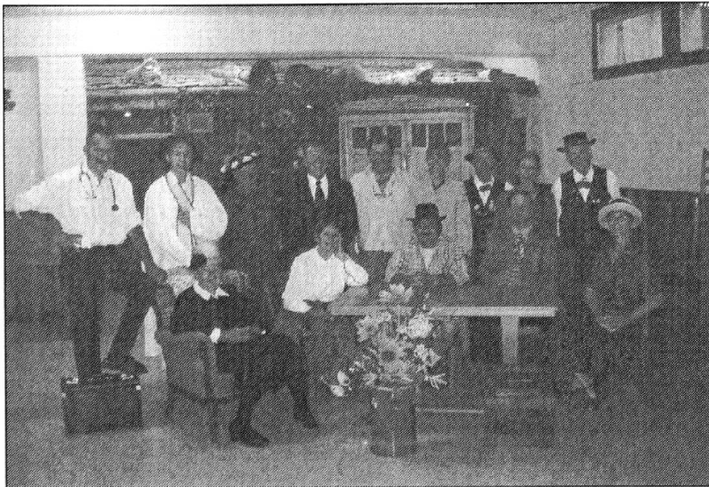
Le groupe théâtral de l'A Cobva.

Chez nous, ce sont les femmes qui commandent, mais elles sont braves et pardonnent quelques excès bien qu'elles ne crachent pas dans le verre. Honneur à elles.