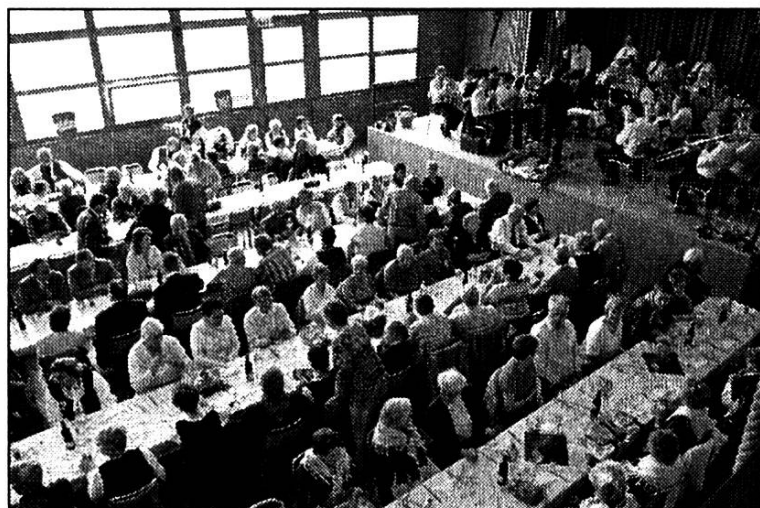
Halle des fêtes, Les Genevez.