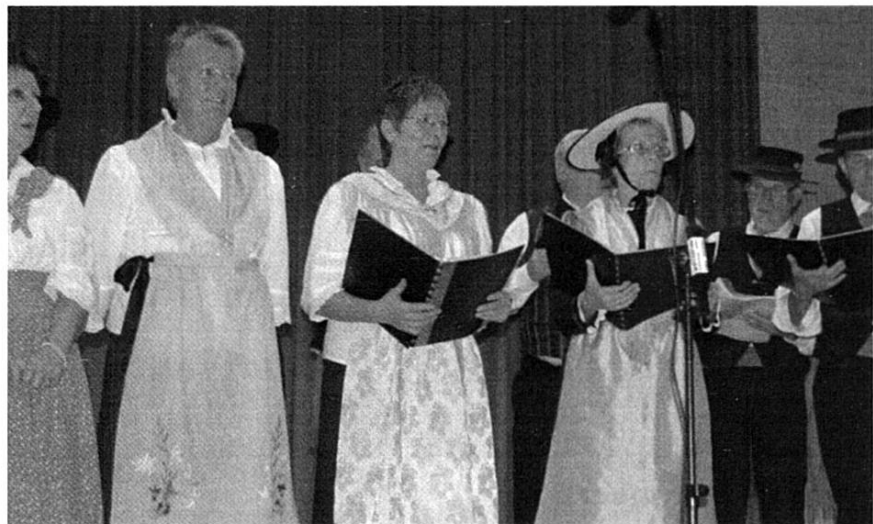
A Cobva, veillée cantonale, 7 nov. 2009.

Pour couronner tout ça, A Cobva organisera le 6 novembre 2010 à la Halle Polyvalente de Châteauneuf la Veillée Cantonale du Patois. Cette rencontre amicale et festive sera l'occasion d'écouter nos divers patois, de rencontrer de vieux amis et, nous l'espérons aussi, ces jeunes désireux de découvrir ce