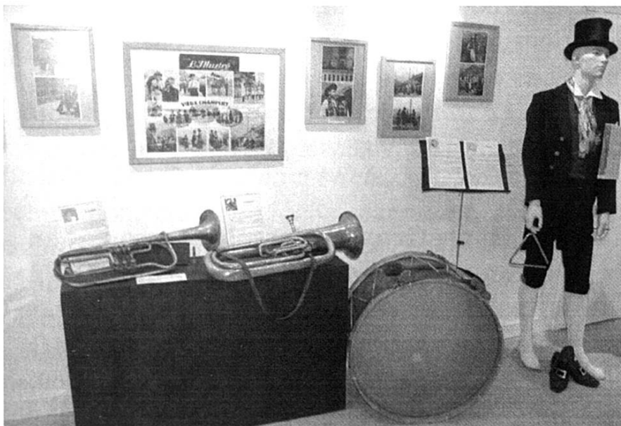
Trombone, bombardon, grosse caisse, triangle, instruments de Champéry 1830 .

LES RÉGIONS FRIBOURGEOISES SE DÉMARQUENT DE L'ENSEMBLE DU TERRITOIRE DIALECTAL REPRÉSENTÉ DANS CE CORPUS PAR LE CHOIX DE LA FORME 'LA BASTRINGUE' POUR DÉSIGNER L'ACCORDÉON, FORME QUI COMPORTE UNE ALTERNANCE CONSONANTI-