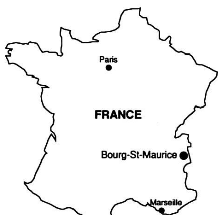
Bourg Saint Maurice, département de la Savoie et région Rhône-Alpes