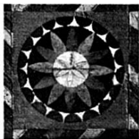
dictionnaire du patois de Nendaz