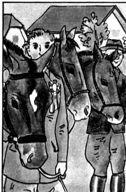
Le marché-concours de Saignelégier. On présente les chevaux primés. Nestlé 1954.