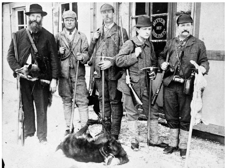
Portrait de chasseurs champérolains en 1898.

Toute personne qui serait intéressée de contribuer à ce projet peut obtenir des renseignements complémentaires au 027/722.91.92 ou par e-mail patois@mediatheque.ch