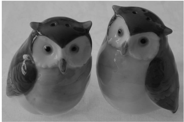
Poivre et sel.

Accenteur alpin, mator . Aigle royal, ouye . Alouette des champs, blâvouo di fin . Bec croisé, bèc crouijià di chapin . Bécasse, bècacha . Bergeronnette, cavoueroula . Bouvreuil, choubli . Bruant des neiges, oujé dè la neik . Bruant jaune, lè zâno . Buse, buse .