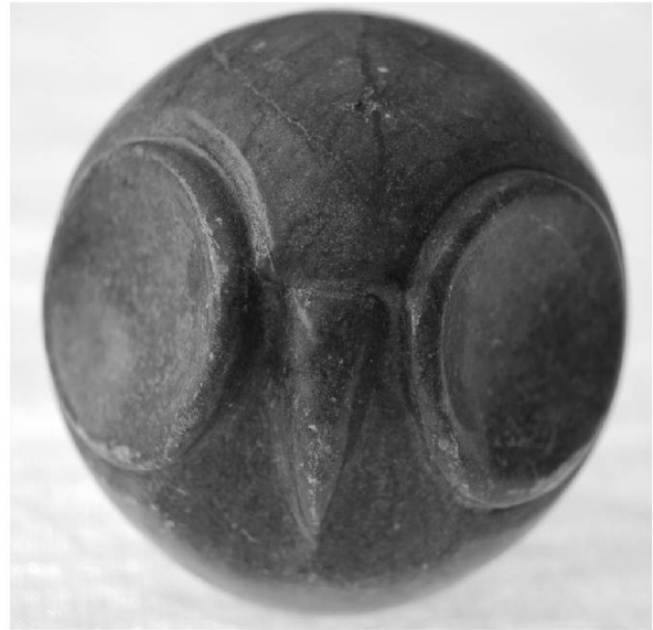
Brésil, pierre à savon.

S'il est un petit animal qui parcourt l'ensemble du domaine et qui souligne l'unité de nos patois, c'est bien la souris dont la désignation repose sur la même base lexicale, offrant peu de variations phonétiques : raite (la Courtine, Franches-Montagnes), rata (Jorat, Gruyère, Marly, Chermignon, Hérémente, Savièse, Nendaz, St-Maurice de Rotherens, Hauteville-Gondon), rate (Leytron, Val d'Illiez). A Bagnes, on rencontre les deux termes : rata ou soùri . Les patois jurassiens présentent le 'ai' qui les distinguent des patois francoprovençaux, comportant tous la voyelle tonique 'a'. Quant à la voyelle finale, elle s'est régulièrement affaiblie en -e dans les patois jurassiens et cette évolution s'est produite dans quelques patois du Valais.