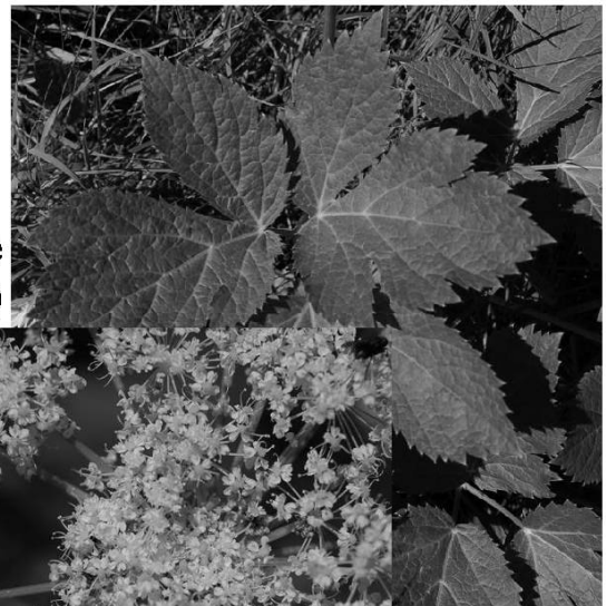
Impéatoire (feuille et fleur)