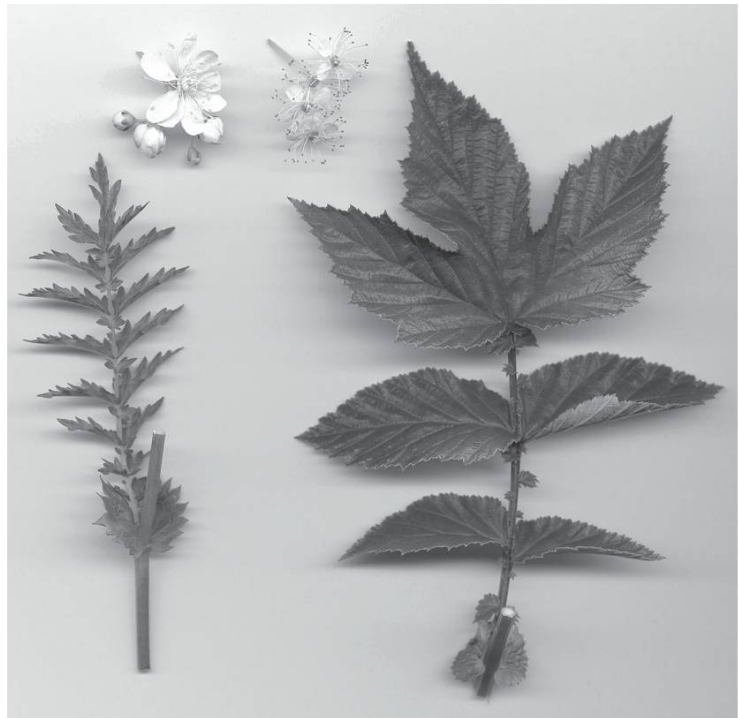
Filipendule et reine des prés

Trèfle artificiel, le trèfle . Petit trèfle, la triolô . Trolle, le bouoton d'ô .