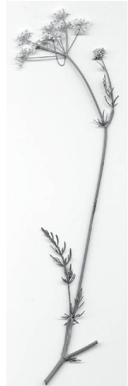
Cumin des prés

La treyolô , le trèfle. Le chanfoin , la luzerne. Li lapé , l'oseille sauvage ( Rumex alpinus ).