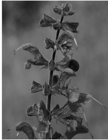
Sauge des prés