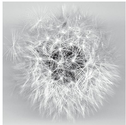
Akènes du pissenlit