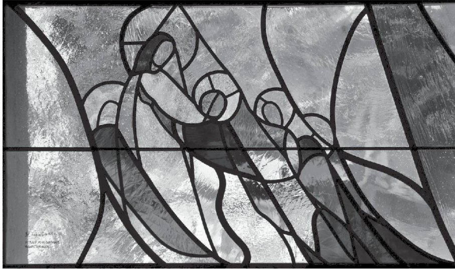
Chapelle d'Uvrier (1968). Vitrail d'Isabelle Tabin-Darbellay.

y'est pròou èhoneïn : Fé awouïre le chore èt parlâ lè moèt. ». Acclameïn la Parola dou BonJiou. - Nô tè lo'eïn, Segniô Jiaizou.