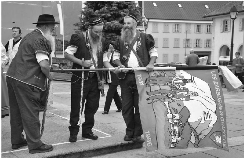
Les Barbus de la Gruyère.