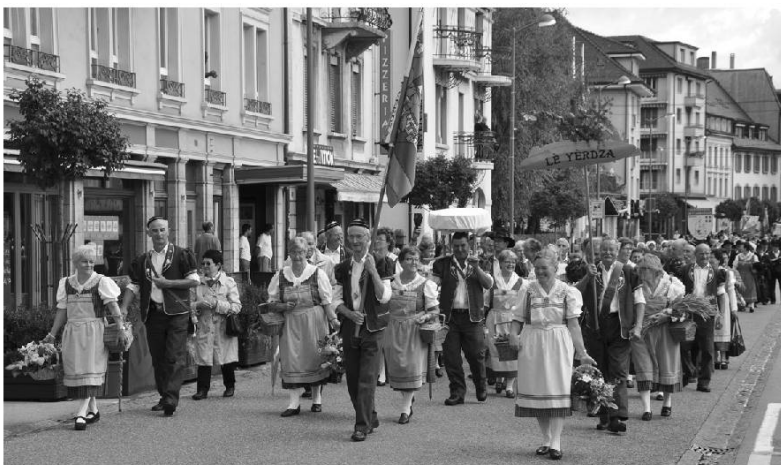
Fribourgeois lors du cortège.

« Votre manifestation est plus qu'une simple fête. Car vous y jouez toutes et tous le rôle de passeur vers d'autres cultures, de passeur entre les cultures. Des passerelles sont jetées à travers la France, l'Italie et la Suisse pour converger vers un point de rendez-vous commun, ce rendez-vous international des patois. Cette volonté de partager ensemble la passion des patois malgré les différences culturelles, linguistiques et religieuses est remarquable. »