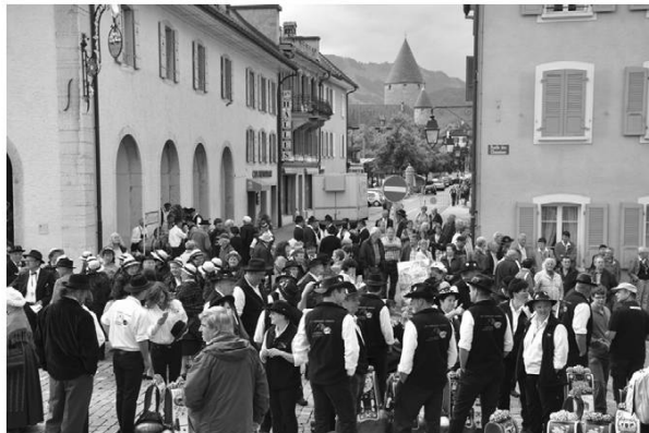
Ambiance à Bulle avant le cortège.