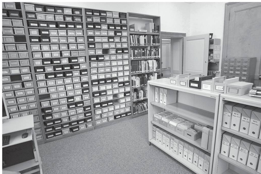
Fig. 1. Une partie des quelque 1'330 boîtes du fichier central du Glossaire .

boîtes d'environ 2'000 fiches chacune, soit un dixième du total des données à publier : depuis 1900 en effet, environ 2,6 millions d'unités ont été collectées et classées dans le fichier central (voir figure 1).