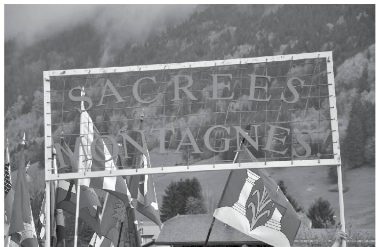
Sacrées montagnes, thème de la Poya d'Estavannens. Photo Bretz, 2013.

Monter à la poulie pour..., quetallâ . Poulie, ascenseur, réa (roue d'une poulie), quetalla (n.f.)