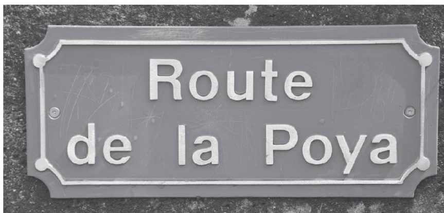
Estavannens (FR). Photo Bretz, 2013.

Le lexique dialectal recueilli autour du thème de la montée se caractérise par sa richesse et son expressivité. Certes, des verbes synthétiques émaillent le discours pour signifier le fait de monter : montâ, poyî, grapelyî, gradalâ (Jorat); montâ (Gruyère) où une formation diminutive adoucit la rigueur de la montée, montolâ , monter en pente douce.