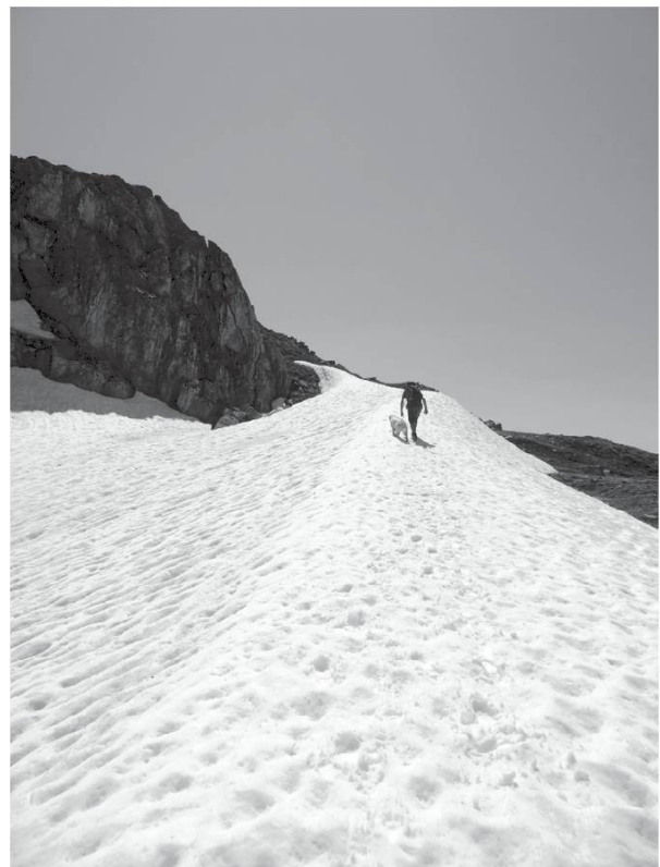
Pas de Lovegno, St-Martin, Val d'Hérens (VS).

Montâ , monter. Montâie , montée, rampe.