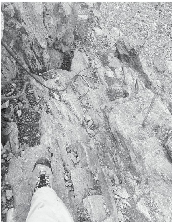
Plan Bertol, Arolla, Val d'Hérens (VS).