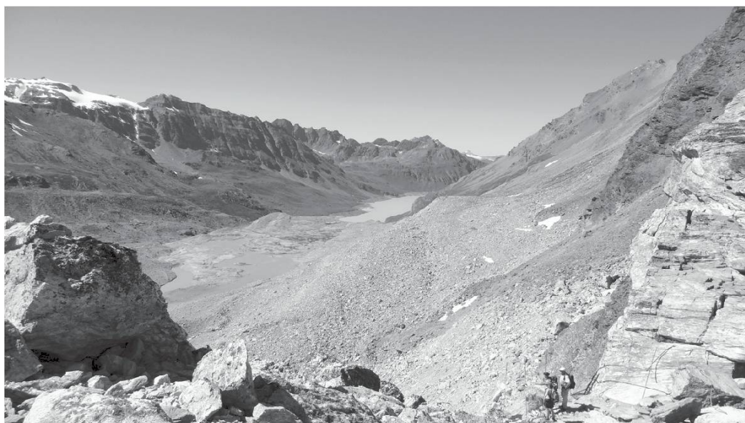
Pas de Chèvre, entre le Val des Dix et le Val d'Hérens (VS).

Alâ choùk damoùn , monter à l'étage supérieur. Alâ à l'amoùn , marcher en montant, litt. aller à l'amont.