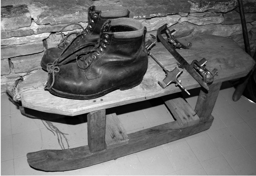
Vieille luge, chaussures et lames à patins. Photo Bretz, 2010.

tsôtin chobrâvè le tsôtin. Fô pâ krêre ke chin dzubyâvè kemin na ludze chu la yache.