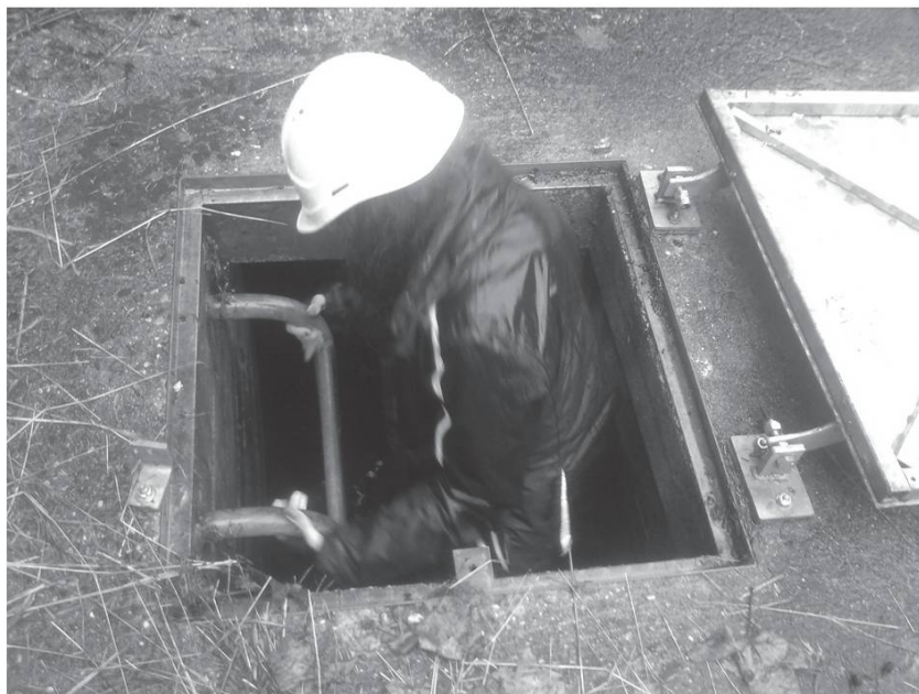
Entrée dans le Tunnel du Prabé.

tape bien fort contre le rocher de la voûte. Depuis 2003, le sol a été bétonné, on peut marcher plus tranquillement mais c'est moins rigolo. Aujourd'hui, il n'y a plus besoin de monter à la prise à la Morge ouvrir la vanne, un ouvrier de Lizerne et Morge accomplit cette tâche. Les vouasseurs qui sautaient dans l'eau froide n'existent plus mais leurs successeurs ont continué la tradition. Après le passage, à la sortie du tunnel, on prend l'apéro ici et là. Pendant quelque temps, la raclette était servie à la Boutse mais maintenant, les invités sont si nombreux que le repas est servi à la salle communale des Binii. Chaque année, la première semaine de mai, c'est la fête de la levée des eaux. C'est l'occasion pour les responsables de la Commune d'inviter à dîner des amis et des autorités du canton. Cela permet de discuter et de faire de bonnes relations.