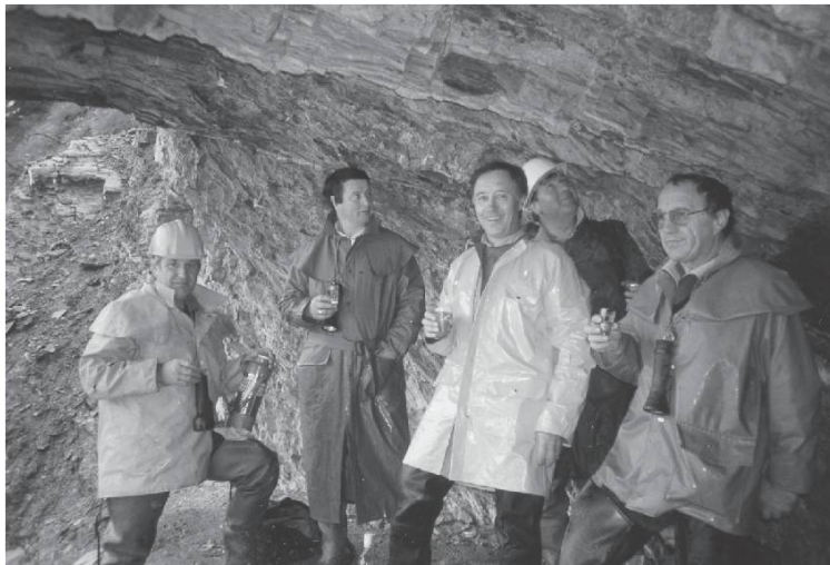
Pause à la fenêtre de Brac en 1992.