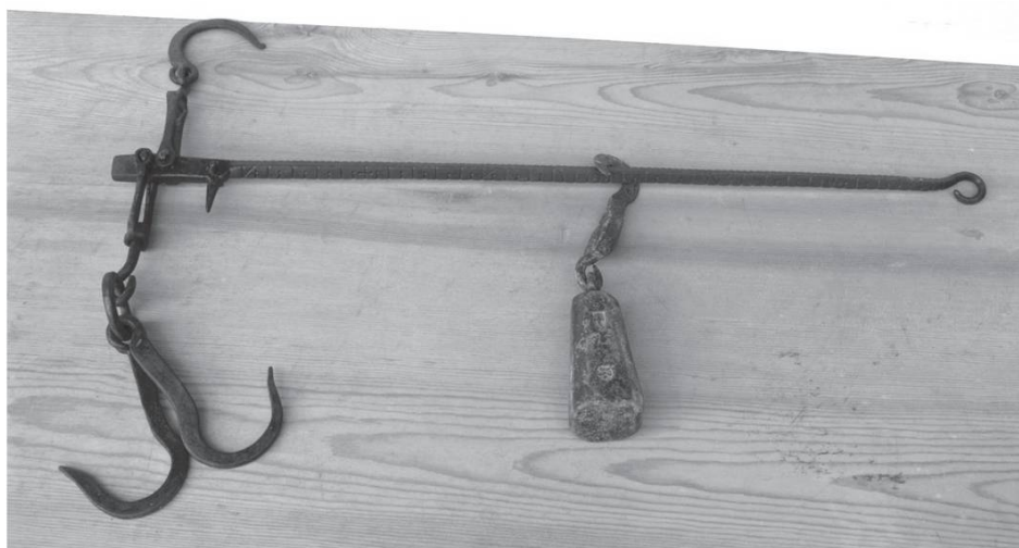
Vyu pèy , vieille balance romaine graduée en livres. Photo Anne-Marie Bimet, Savoie.

« Lè reús dou pachâ êrzôn lo prèjèin por fèrè flioréc dèmàn. » « Les racines du passé irriguent le présent pour faire fleurir l'avenir. »