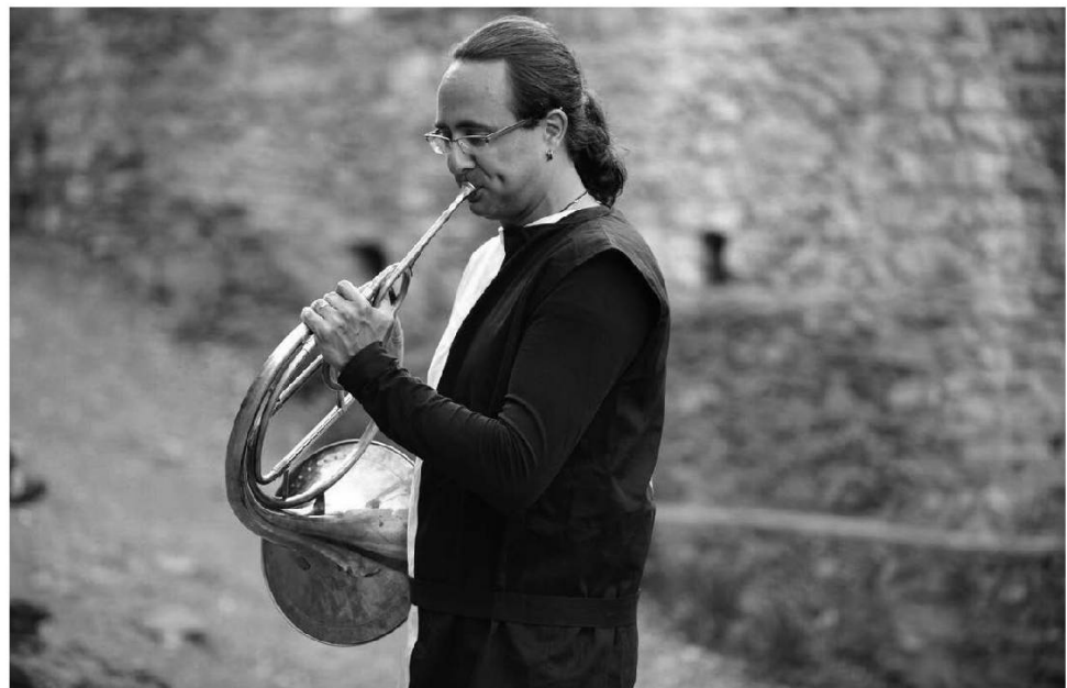
Joueur de cor.