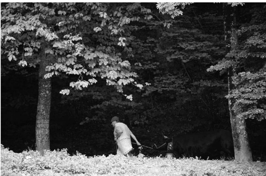
La scénographie profite du décor naturel. Photo Jean-Claude Campion, été 2015.

Ou furi ! bou chakrà ! yé prèvondamin bleu ! On chin on chohyo d'ê ardin ke vo pènètro, È l'intrâye ou yin d'ouna byantse fenithra ; On mèhyo cha pinchâye ou hyà-konfu di j'ivouè ; No j'an le dou bouneu d'ithre avu lè j'oji È dè vêr, dèjo l'âbri di brantsè printanyirè, Hou moncheu fére avu hou damè di j'è.