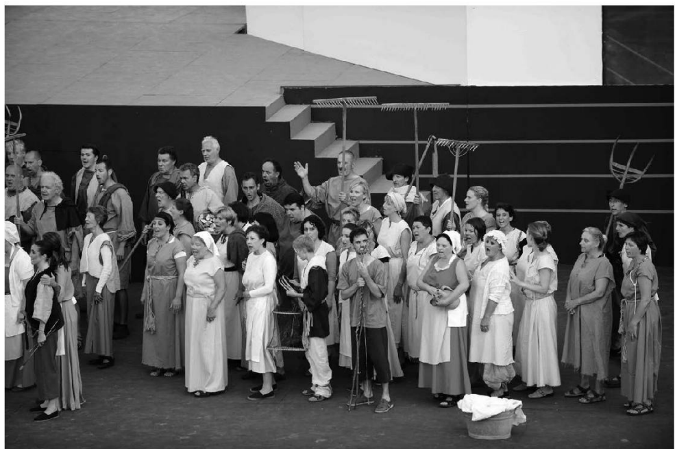
Les choristes.

Hlë ömo féire avouë hlë fène de pleyjin complemin.