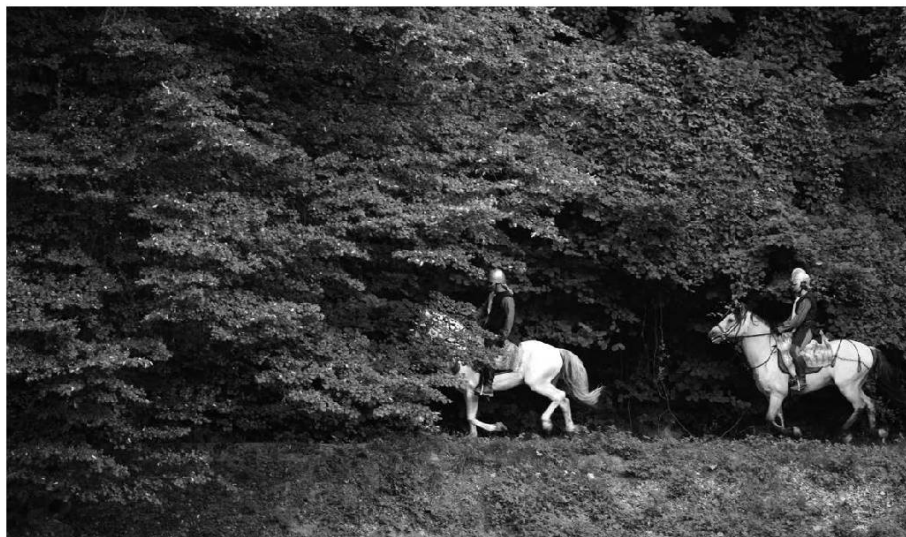
Les figurants investissent le décor naturel.

Pour le premier concept, on relève pas moins de six verbes patois qui nuancent le fait de mourir : mouère (Fully), mouèrè (Allières), s'étyin (Bagnes), rin ou'âma (Savièse), trèpâche (Romont1), rancoiye (Les Foulets), raincaye (Jura), rakuchon (Treyvaux).