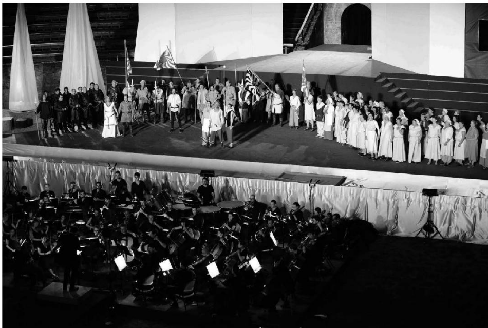
Chœur et orchestre. Photo Campion.

O salyî ! bou de valeu ! ciè trétot blyû ! On recheint on socclio d'âi tot vî que vo traverse Et lo perte tot lyein d'onna blyantse bornatse On mècllie sa peinsâie âi colâo de l'îguie dâi z'adzî On a lo dâo bounheu d'ître avoué lè z'ozî Et de vouâtî, dèso l'avri dâi bronde dâo salyî Clliâo monsu fére avoué clliâo dame po lâo frèyî.