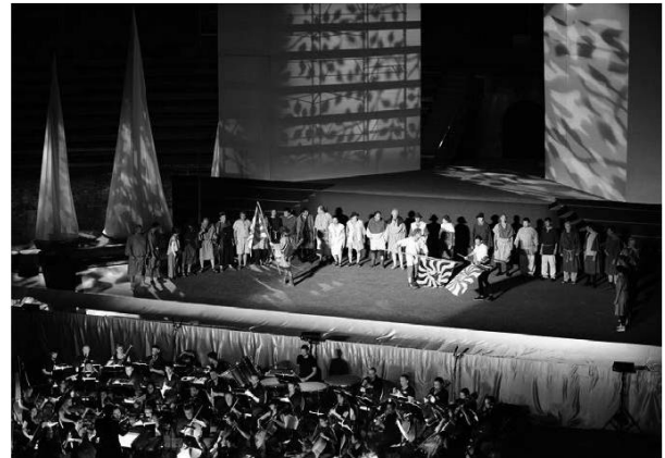
L'Opéra du Rhône.

Ah ! Lè rougè môgrâ lè j'èpenè Chon on chunyo : le bon Djiu no j'âmè.