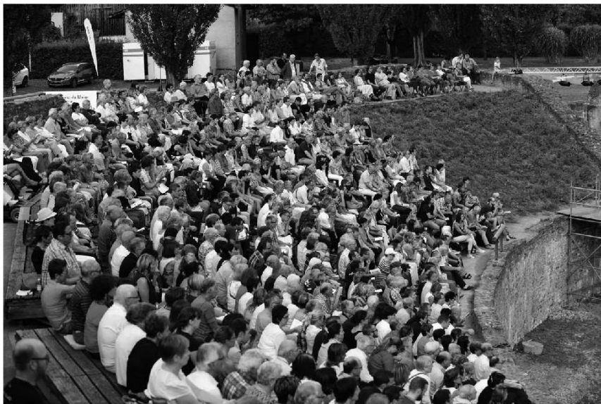
L'amphithéâtre d'Octodure. Photo Jean-Claude Campion, août 2015.

Le caractère oratoire de la poésie hugolienne interpelle immédiatement le lecteur-traducteur. En effet, la négation de la formule impérative instaure d'entrée la communication entre le poète et le lecteur et confère au texte une dimension argumentative dans la discussion relative à l'existence de Dieu :