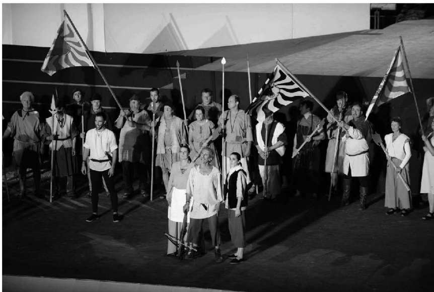
Les Suisses.

Chloeu Monchiu è chle Dame chèn fèrè dè plèiji !