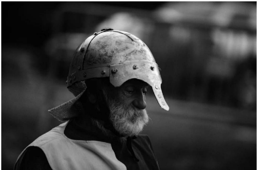
Les cavaliers.

Ô faurtèn ! Zok chakréye ! Chièl pè tànké iyén pèr lè prèondjyok N'aun chèn aun chofle d'èh vévèn kè vo vàn iyén dédén la bauye Ê bièn louèn lo pertouè d'auna fénétra blantsa ; N'aun mêklye chèn kè n'aun moujata au kliâ – topo déj'èvoué ; Aun'ha lo dougs pléjék d'éthre avoué lèg'joujé Ê dê vèdre dêjo la chotte dég ràngmé dau faurtèn, Hlo mouchiou fère dè mauyè avoué hlè dròlè.