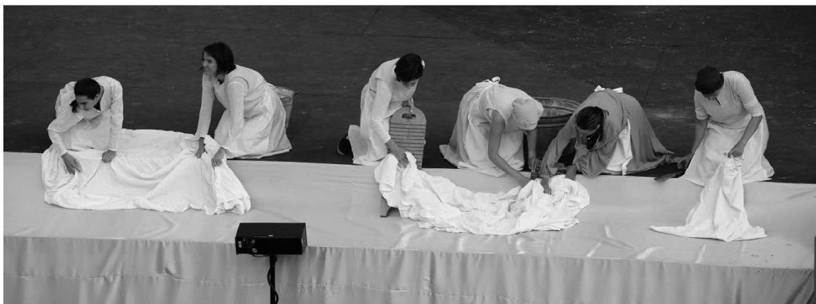
Les lavandières.

Ô Feurtin ! Dzint'è dzeu ! Biô chièl toti fran blu ! Te chin on choshië d'é, ardan, kë te, travèrch'è, Pië yuin, on vaï na fënittr'è blantse, dza uvéch'è ; Li pinchây'è, chë mèshi'on din le mi-topouë dè l'ivouë ; Keïn bouoneu d'îtr'è avoui li pouëdzeïn, è pouëvaï li j'avouir'è Dè vèr'è, a l'adou di brants'è garniè dè shieu partinchiv'è, Shioeü moucheu, fir'è, a shiè dam'è dè dzint'è magniër'è.