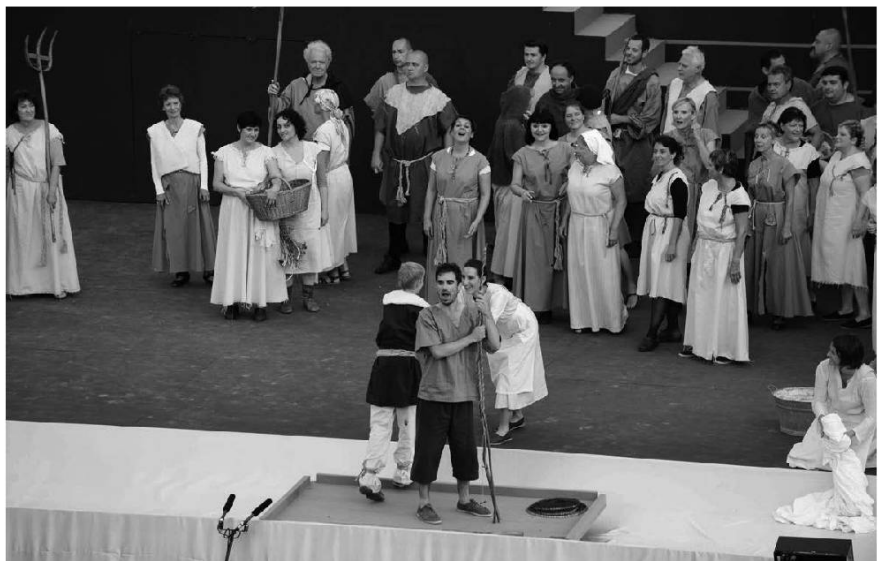
La traversée.

Ô fourtèïn ! Ô zóouch chakràye ! Chyèl pê chèrèïn ! Oun chèn ènn ounn kòd d'è vik kù vô travèrche, È ch'òuvr' óou louèïn ounn fènîthra blàntse; Chè mèhlye lù pèinchâye avoué d'évoue tròbl' è klyâra; Ounn è próou bunnéije prumyè lè-j-óoujèss È dè verre, à rèkouéik déi bràntse, kan chon foûra lù zùss, Thlóou-j-ómo kothèrjyè avoué dè dróoule.