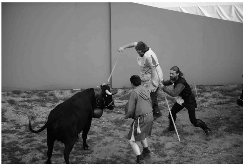
Dans l'arène.

È de vère, a l'èvri di brantsè ou furi, Hou monchu è hou damè tan bin gigenatsi.