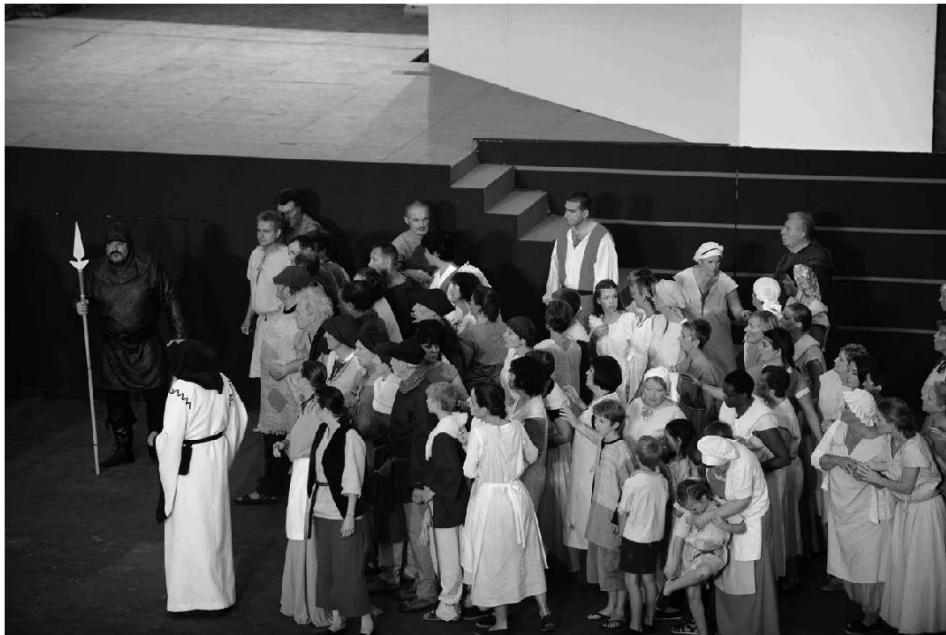
Choristes et figurants.

Face à un monument de la poésie française, il s'agit d'affirmer, sans orgueil, la richesse de la langue de cette terre et sa capacité à exprimer le discours sentimental dans une vision poétique. Les images du passage de l'hiver à la lumière joyeuse du printemps baignant la naissance de l'amour éclipsent la nuit hivernale.