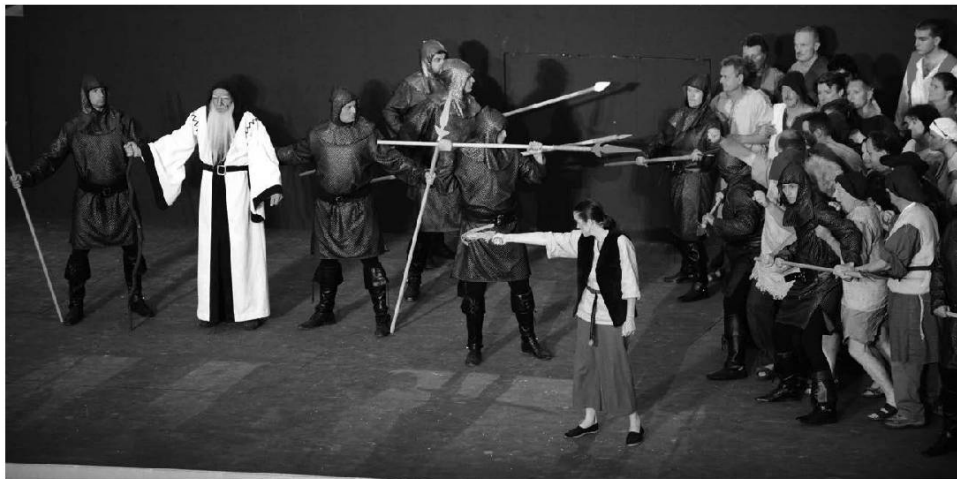
Les hommes armés.

Ces bés chires que faint des mainies en yos daines.