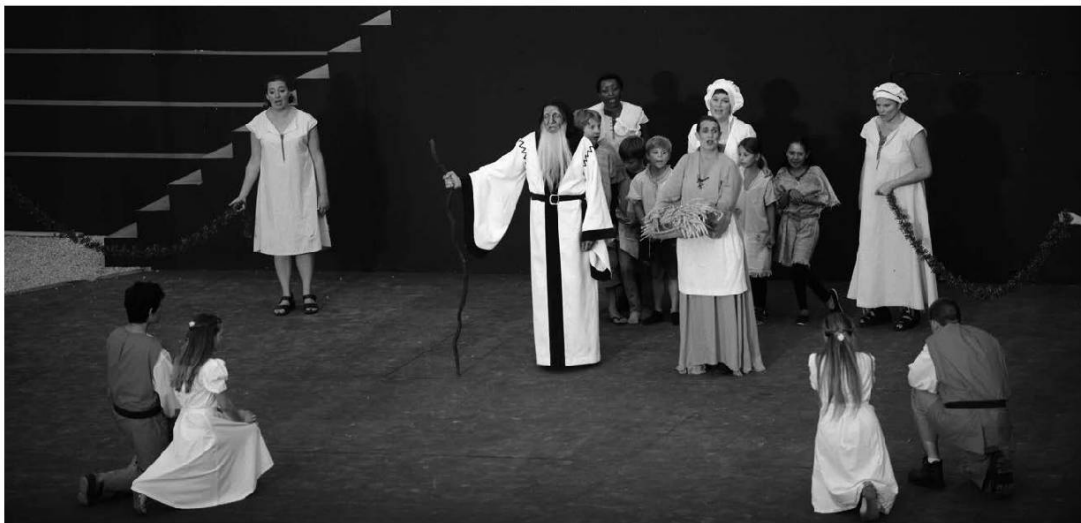
Au village.

Ces chires que faint des belles ma- nieres en ces daines.