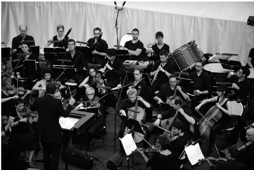
L'Opéra du Rhône.

Ho! Furi, bou chakrà! Hyi prèvonda- min bleu On chan on chohyo d'èvi, ke no pènètrè E l'ouverture o yin d'ouna byantse fenithra On mèhyè chon moujiron, ou hyà- ochkuro di j'ivouè On'a le dà bouneu d'ithre avouè lè j'oji E dè vère dèje l'achotha di brantsè tinpruvè Ho moncheu fére avouè hou damè di manèrè