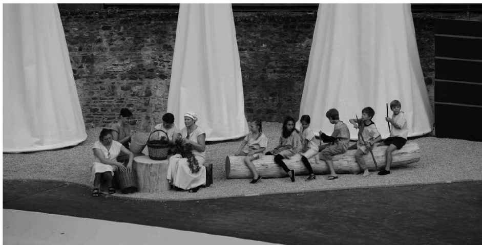
Au village.

Ces chires faire d'aivô ces daines des mainieres.