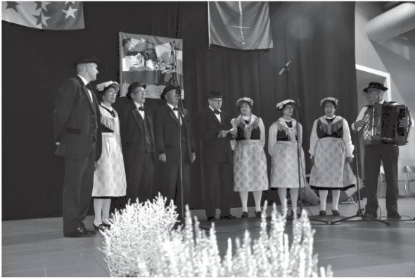
Lé Partichyou de Chermignon.