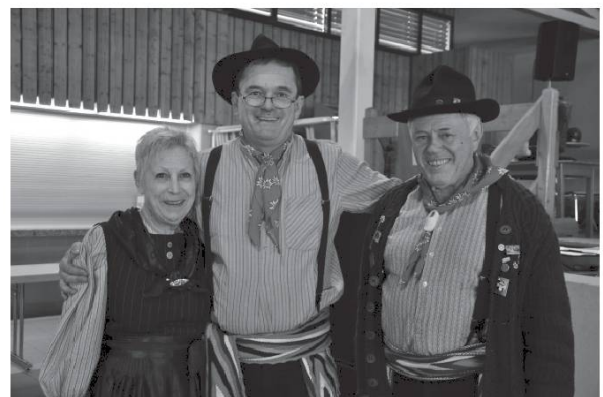
Société des Costumes et Patois de Savièse.