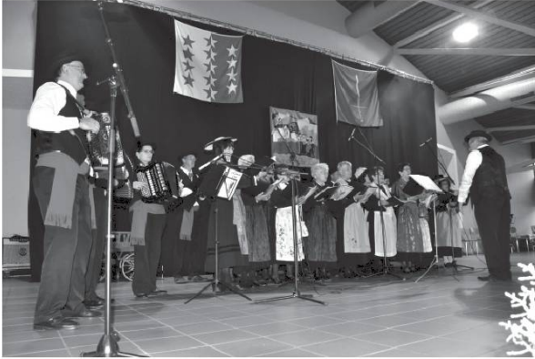
A Cobva de Conthey.